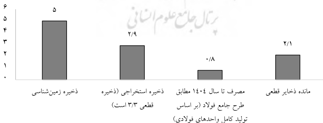
نمودار ۲- وضعیت ذخایر سنگ آهن ایران تا سال ۱۴۰۴ (میلیارد تن)

متوسط عیار سنگ آهن ایران حدود ۴۶ درصد و معادن سنگ آهن عموماً با زمینه غالب مگنتیتی و ذخایر نسبتاً کمی از کانسارهای آهن دارای سنگ هماتیتی است؛ به طوری که بیش از ۹۰ درصد ذخایر سنگ آهن از نوع مگنتیتی و بقیه هماتیتی است. از سال ۱۳۵۱ تا پایان سال ۱۳۹۹، حدود ۹۵۵ میلیون تن سنگ آهن از معادن ایران استخراج شد. سال