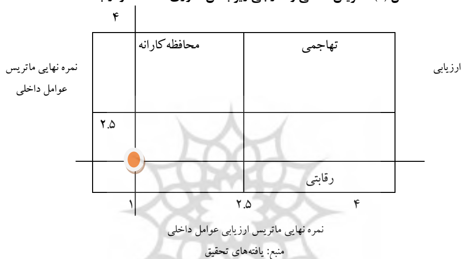
شکل (۱): ماتریس داخلی و خارجی زیر بخش فناوری اطلاعات و ارتباطات

استراتژی‌های همین داده‌ها شکل گرفته است. نخست جمع نمرات نهایی ماتریس عوامل خارجی روی محور مربوط به عوامل خارجی مشخص شد و عمود بر آن خطی به موازات محور ماتریس عوامل داخلی کشیده شد. میانگین نمرات نهایی ماتریس عوامل داخلی نیز روی محور ماتریس عوامل داخلی مشخص شد و عمود بر این محور و همچنین به موازات محور ماتریس عوامل خارجی خطی رسم شد. محل تقاطع خطوط نقطه‌چین نشان از برخورد این دو خط دارد. ناحیه‌ای که این دو خط به هم برخورد کردند نشان می‌دهد که همان استراتژی‌های گروه WT می‌باشد. زمانی که بخش‌ها در خانه تدافعی قرار می‌گیرند یعنی باید نقاط ضعف داخلی را برطرف کنند و از تهدیدات خارجی پرهیز نمایند.