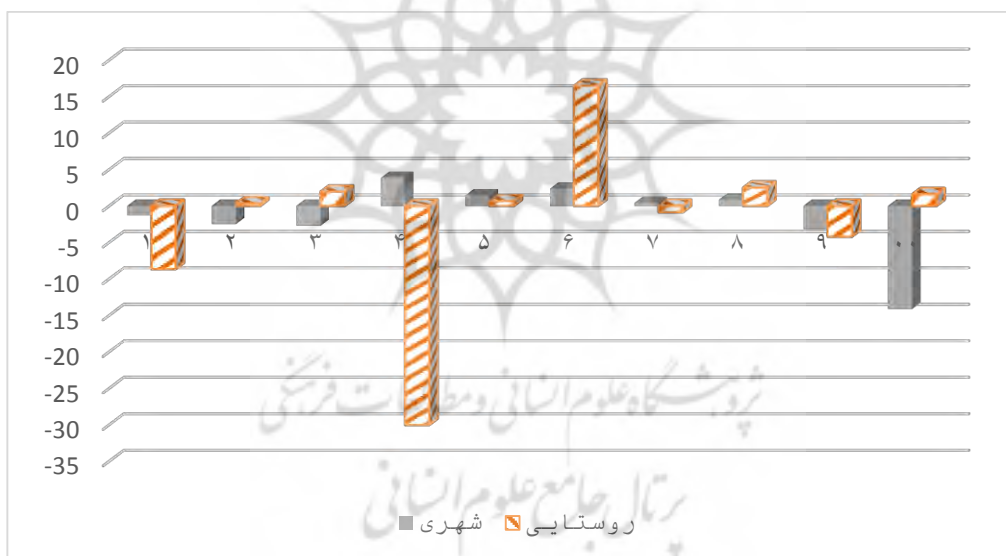
نمودار (۱) درصد تغییرپذیری‌های کالری دهک‌های مختلف درآمدی خانوار در اثر اعمال سناریوی اول Figure (1) The percentage change in calories of different household income deciles due to the application of the first scenario

درصد تغییرپذیری‌های کالری دریافتی خانوارهای شهری و روستایی به تفکیک دهک‌های درآمدی در اثر اعمال سناریوی کاهش ۲۰ درصدی تولید فرآورده‌های دامی در نمودار (۱) ارائه شده است.