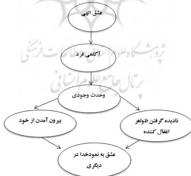
مدل ۱: الگوی تحقق و بالندگی عشق بر اساس نظرات اندیشمندان مسلمان