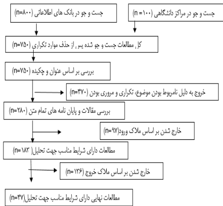
شکل 1. نمودار پریسما جهت نمایش تعداد نمونه مطالعات

جهت بررسی، تجزیه و تحلیل داده‌های مستخرج از پژوهش‌های اولیه، برای هر مطالعه اندازه اثر محاسبه شد. هرچند در تعدادی از پژوهش‌ها به جهت وجود متغیر تعدیل‌کننده یا وجود ابعاد یا مقیاس فرعی در متغیرهای مستقل یا وابسته اندازه‌های اثر متعددی محاسبه شد. همچنین اندازه اثر ترکیبی با دو مدل اثرات تثبیت شده و تصادفی 3 ، نمودار فیزی 4 ، تحلیل حساسیت، آزمون همگنی 5 ، مجذور I و آماره نمونه امن از تخریب 6 و فرا رگرسیون 7 استفاده شد. برای محاسبه اندازه‌های اثر و نیز