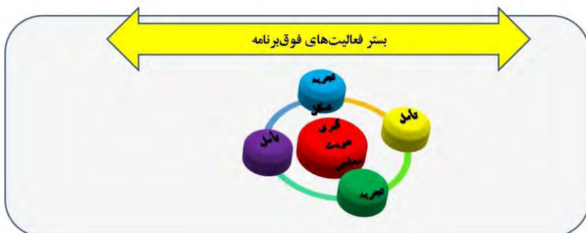
شکل (۲) ارتباط تجربه و تأمل در حرکت چرخشی ۱ فعالیت های فوق برنامه

طیبه) (ویژگی ۱) تأمل نمایند و برابر ویژگی (۱۵)، مواجهه فکورانه، نقادانه، خلاقانه و هنرمندانه در فعالیت فوق برنامه داشته باشند.