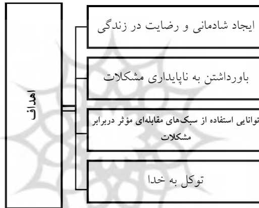
نمودار ۲. اهداف تفکر مثبت از دیدگاه اسلام

نگری را که عمیقاً به خدا توکل می‌کند و خود را با تمام وجود، عبد خدا می‌داند، برهم زند؛ زیرا هرچند به‌ظاهر، تمام درهای عالم اسباب به‌رویش بسته شوند و او از هر نظر، درمانده باشد، براساس تفکر مثبتی که دربارهٔ پروردگار خویش دارد، می‌داند تنها کسی که می‌تواند قفل مشکلات را بگشاید، نور امید در دل‌ها بدمد و درهای رحمت را به روی انسان‌های درمانده باز کند، ذات پاک باری- تعالی- است (مکارم شیرازی، ۱۳۷۴، ج. ۱۵، ص. ۵۱۷)؛ بدین ترتیب، هدف آن است که انسان مثبت‌نگر با اتکا به خداوند متعال، به‌راحتی در برابر مشکلات تسلیم نشود و با روحیهٔ قوی و عزم استوار در مراحل مختلف زندگی، گام بردارد.