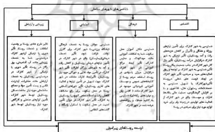
شکل ۲. مدل تحلیلی نقش شهرهای ساحلی در توسعه روستاهای پیرامونی.