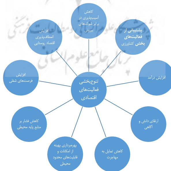
شکل ۱. مهم‌ترین کارکردهای تنوع‌بخشی فعالیت‌های اقتصادی

به‌طور کلی اقتصاد روستایی به تولید در بخش کشاورزی و صنایع وابسته به آن و بخش غیر کشاورزی، شامل معادن، صنایع دستی، ساخت‌وساز، تجارت، حمل‌ونقل، خدمات دولتی و شخصی گفته می‌شود. اقتصاد پایدار به تداوم و پایداری تولید و درآمد، مقاومت در برابر چالش‌های اقتصادی، اجتماعی و طبیعی اشاره دارد (تقدیسی و همکاران، ۱۳۹۷، ۳). در حال حاضر وابستگی اقتصاد روستایی به بخش کشاورزی و عدم پویایی و تنوع در آن منجر به افزایش آسیب‌پذیری در برابر شوک‌های بیرونی (خشک‌سالی‌های پی‌درپی، سرمازدگی، نوسان قیمت جهانی محصولات کشاورزی و ...) گردیده است. خشک‌سالی پرهزینه‌ترین بلای طبیعی بخش کشاورزی است و زیان‌های بسیاری را بر بخش کشاورزی و منابع آبی وارد می‌سازد و به دلیل اینکه محدوده‌ی وسیع‌تر و جمعیت بیشتری را دربر می‌گیرد، پیچیده‌تر از دیگر مخاطرات طبیعی است. با توجه به اینکه افزایش تقاضا برای آب، محدودیت ذخایر و منابع و تغییرات آب‌وهوایی، انتظار می‌رود تعداد و شدت خشک‌سالی‌ها در آینده افزایش یابد. از آنجاکه اقتصاد روستایی اتکالی قابل توجهی به فعالیت‌های کشاورزی دارد، شعاع تأثیر پدیده‌ی خشک‌سالی در مناطق روستایی بسیار بالاست (جعفری و همکاران، ۱۳۹۱، ۱۷۲). اهمیت رهیافت متنوع‌سازی فعالیت‌های اقتصادی بدان جهت است که حتی اگر کشاورزی دچار رکود (به دلیل خشک‌سالی و نوسان‌های بازار و ...) شود، اقتصاد روستایی غیر زراعی