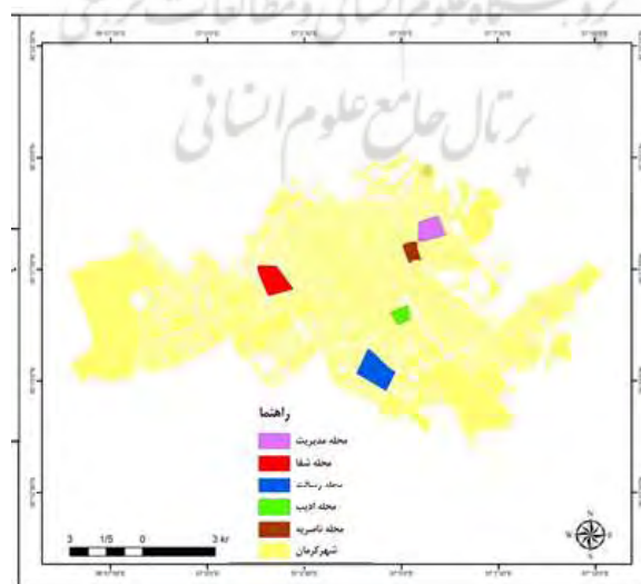
شکل ۲- موقعیت محلات مورد مطالعه در شهر کرمان، (ترسیم: نگارندگان)