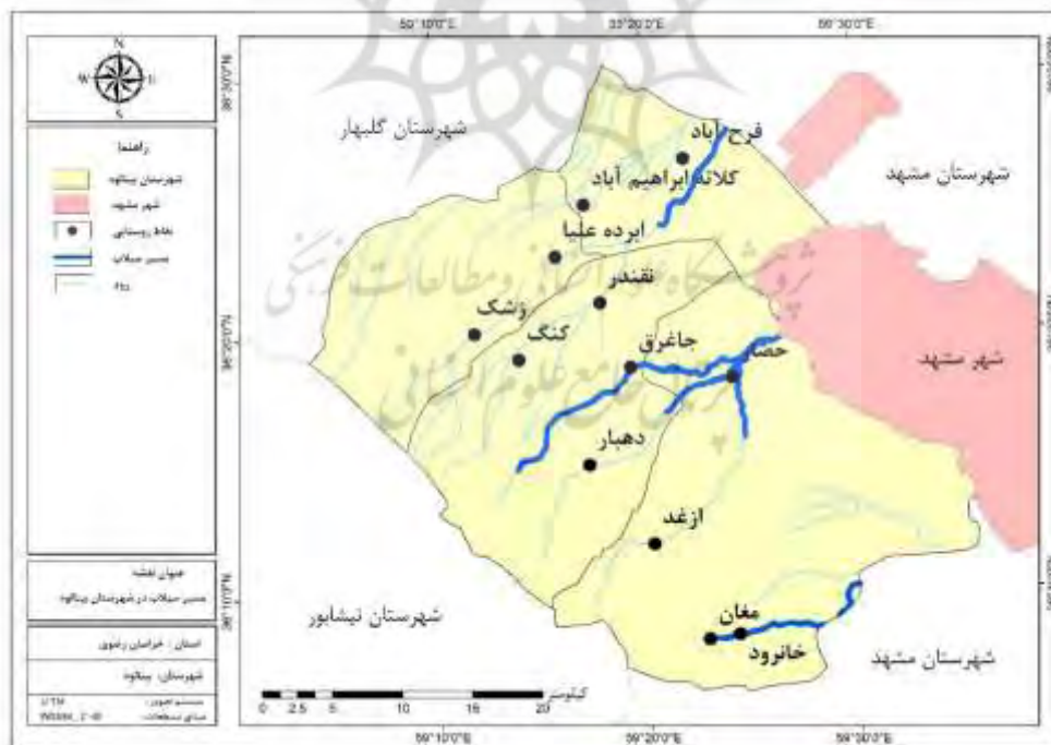
شکل (۲) نقشه موقعیت سیاسی روستاهای مورد مطالعه و قرارگیری در پهنه سیلابی (نویسندگان، ۱۴۰۰)

بر اساس آخرین تقسیمات کشوری شهرستان بینالود (طرقه و شاندیز) در پایان سال ۱۳۹۵، ۲ شهر، ۲ بخش، ۴ دهستان، ۶۹ روستا، ۵۳ روستا دارای سکنه و ۴۶ روستا بیش از ۲۰ خانوار دارد (برنامه و بودجه، ۱۳۹۵: ۴۰۵؛ سایت استانداری خراسان رضوی، ۱۴۰۱). روستاهای مورد مطالعه به لحاظ جغرافیایی در مسیر رودخانه‌های اصلی شاندیز و طرقه قرار دارد. حوضه آبریز بند گلستان در دامنه شمالی ارتفاعات بینالود قرار داشته است و سه سرشاخه اصلی به نام رودخانه‌های جاغرق، دهبار و مایان دارد که در محل روستای گلستان به هم پیوسته و وارد بند گلستان می‌شود. سرشاخه‌های این حوضه آبریز از کوه‌های شغدر، جاغرق، آسیابان و قلعه گاو سرچشمه گرفته و پس از عبور از وکیل‌آباد در محور جاده طرقه وارد جلگه آبرفتی دشت مشهد می‌شود (موسوی حرمی و همکاران، ۱۳۸۲: ۸۸). زمانی که شدت بارش‌ها به خصوص طی روزهای فروردین‌ماه در این منطقه افزایش می‌یابد، به بروز روان آب، آب‌گرفتگی و سیلابی شدن مسیل‌ها در برخی روستاهای این منطقه منجر می‌شود؛ همچنین طغیان رودخانه در شهرستان طرقه شاندیز پس از تخریب دیواره حفاظتی رودخانه به مسیرهای ارتباطی باغات خسارت وارد می‌کند و موجب تخریب بخش‌هایی از جاده ارتباطی روستاها می‌شود. در شکل (۲) روستاهای مورد مطالعه این پژوهش و مسیل رودخانه‌های این منطقه نشان داده شده است (شکل ۲).