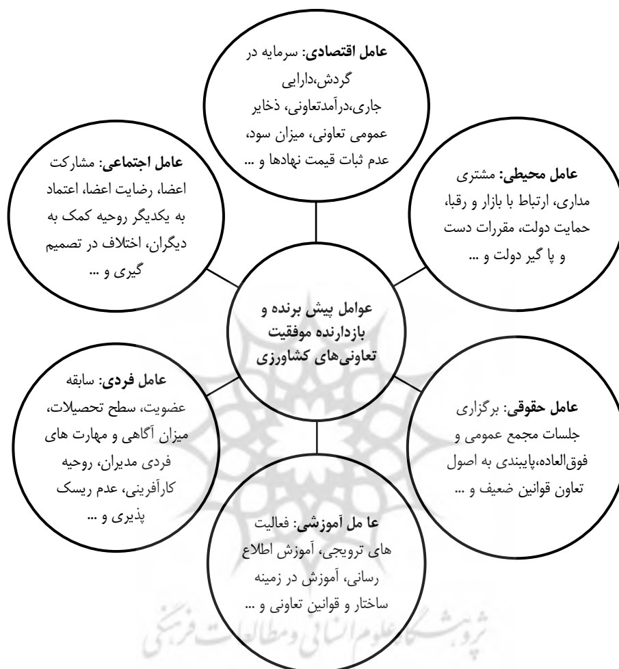
نمودار ۱. مدل مفهومی تحقیق