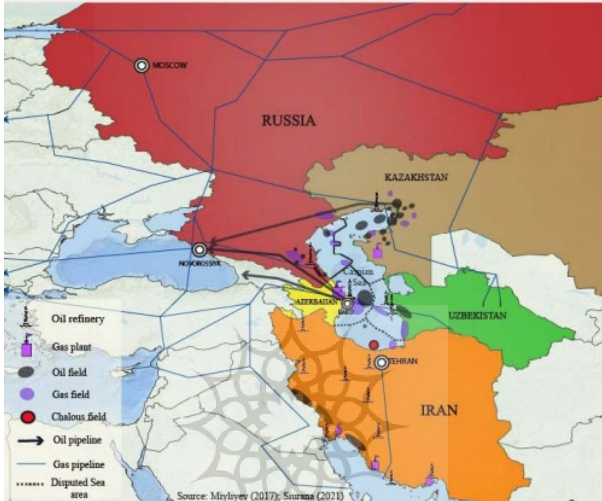
Map 1: Oil and gas in the Caspian region and beyond. Self-elaboration.

نمودار ۲ مسیرهای انتقالی نفت و گاز از مسیر ایران و روسیه (Miguel, 2022:8).