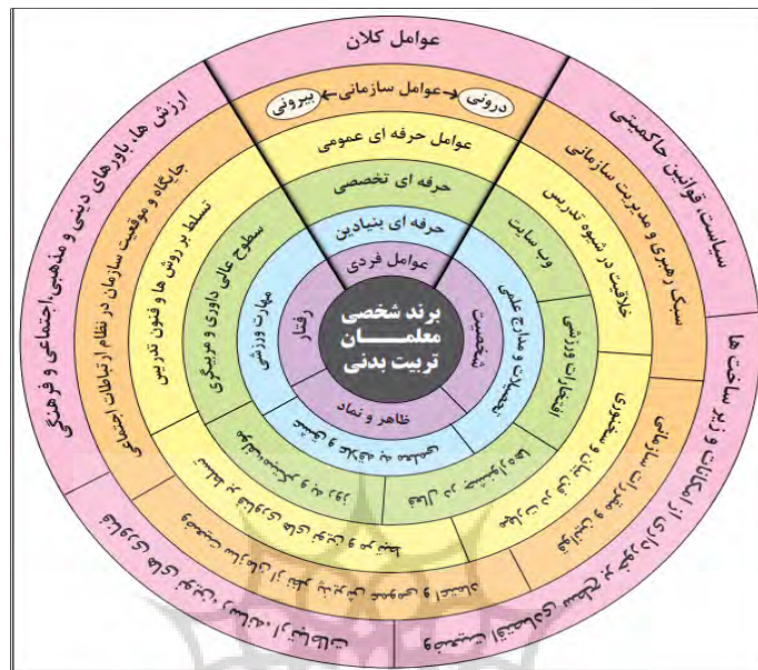
شکل ۲- مدل برند شخصی معلمان تربیت بدنی ایران

بر پایه این مدل که در شکل ۲ قابل مشاهده است، در هسته میانی مدل، «برند شخصی معلمان تربیت بدنی ایران» قرار گرفته است و «عوامل فردی»، «عوامل حرفه‌ای و شغلی»، «عوامل سازمانی»، «عوامل کلان محیطی» به عنوان عوامل مؤثر بر برند شخصی معلمان تربیت بدنی معرفی شده‌اند. عوامل فردی و مؤلفه‌های شغلی و حرفه‌ای با توجه به تأثیر مستقیمی که دارند در نزدیک‌ترین موقعیت نسبت به پدیده محوری قرار گرفتند و مؤلفه‌هایی همچون عوامل درون و برون سازمانی و عوامل کلان، محاط بر سایر ابعاد است و به طور غیر مستقیم می‌توانند بر شکل‌گیری برند مؤثر واقع شوند، و بروز و رشد و توسعه مؤلفه‌های شغلی و فردی را تحت تأثیر قرار بدهند. همان‌طور که در مدل اولیه تحقیق اشاره شد، خبرگان مورد سؤال در این تحقیق به این نکته تأکید داشتند که مؤلفه‌های سازمانی و کلان محیطی می‌توانند با اثرگذاری بر دو گروه مؤلفه‌های فردی و حرفه‌ای بر شکل‌گیری برند شخصی معلمان مؤثر واقع شوند، اما آنچه که مستقیماً در ایجاد آن قابل مشاهده و درک است مؤلفه‌های فردی و حرفه‌ای است، به این ترتیب مدل نهایی تحقیق دو مؤلفه مورد اشاره را نزدیک به پدیده محوری و ابعاد دیگر را در حلقه‌های دورتر و محاط بر آنها تعیین کرد.