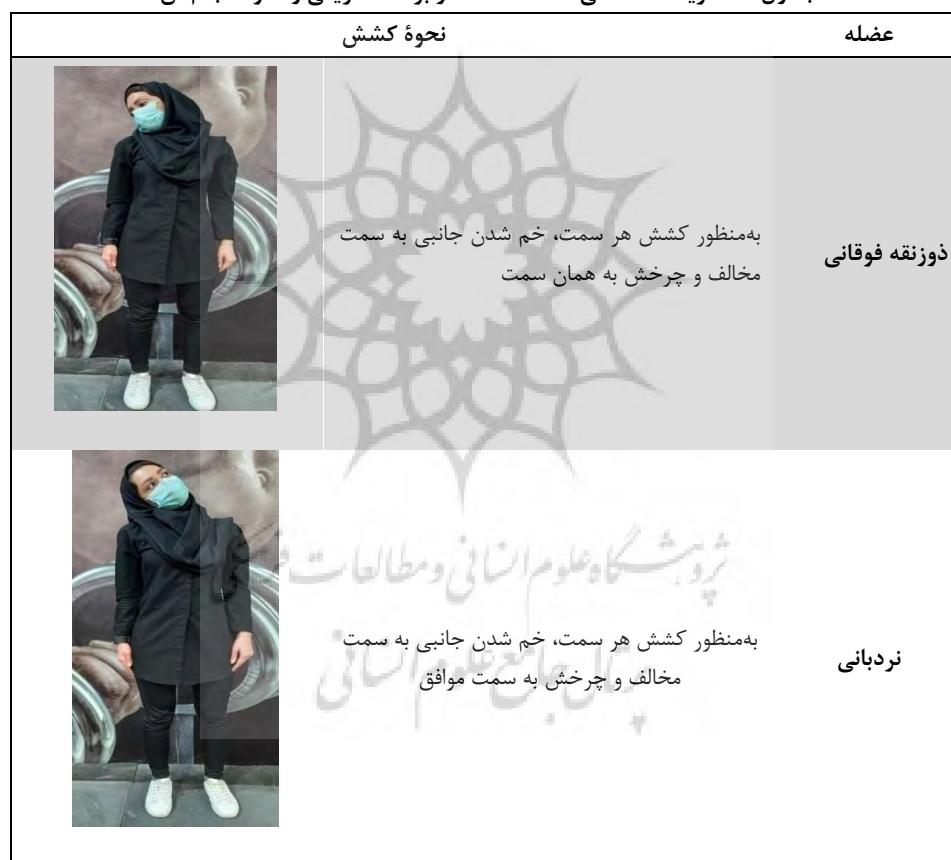
جدول ۱- تمرینات کششی استفاده‌شده در برنامه تمرینی و نحوه انجام آن

هشت هفته، هر هفته سه جلسه و هر جلسه ۴۵ دقیقه اجرا کردند. رژیم تمرینی شامل دو بخش بود: بخش اول به اجرای تمرینات کششی (کشش عضلات دوزنقه فوقانی، نردبانی، گوشه‌ای، کشش کپسول خلفی و قدامی) اختصاص داشت و بخش دوم شامل تمرینات قدرتی (بالا انداختن شانه‌ها، نشر از جلو، نشر از جانب، حرکت پروانه‌ی معکوس و گرفتن غبغب کنار دیوار) بود که با کش تراباند انجام می‌شد (جدول‌های شماره ۱ تا ۳). سرانجام در پایان هشت هفته تمرینات اصلاحی، بار دیگر تمام آزمودنی‌ها ارزیابی شدند و میزان درد و ناتوانی گردن و شانه و زاویه کرانیوورترال آن‌ها در پس‌آزمون اندازه‌گیری شد.