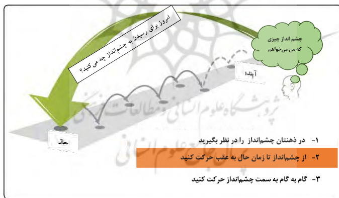
شکل شماره ۱. روش پس‌نگری

روش تحقیق مورد استفاده در این پژوهش روش ترکیبی (کمی و کیفی) می‌باشد که ستون فقرات آن را می‌توان مراحل ۶گانه روش پس‌نگری ۲ به‌شمار آورد. در خصوص روش پس‌نگری می‌توان عنوان داشت که یکی از روش‌های مرسوم در حوزه آینده‌پژوهی به شمار می‌آید. این روش در پی توصیف یک وضعیت آینده بسیار مشخص و خاص و آینده‌ای مطلوب و مراحل دستیابی به آن می‌باشد. حرکتی گام به گام از آینده به امروز، تا مکانیسمی را آشکار سازد که از طریق آن، آن آینده مشخص از زمان حال به دست آید و در پی پاسخ به این پرسش بنیادی می‌باشد که «اگر می‌خواهیم به هدف خاصی برسیم، چه اقداماتی باید انجام شود؟» ۳ در این روش روندهای قبلی و فعلی نادیده گرفته می‌شود و مسیر بازگشت از وضعیت آینده به زمان حال (شکل شماره ۱) مورد توجه می‌باشد. (Hickman, Banister, ۲۰۱۴)