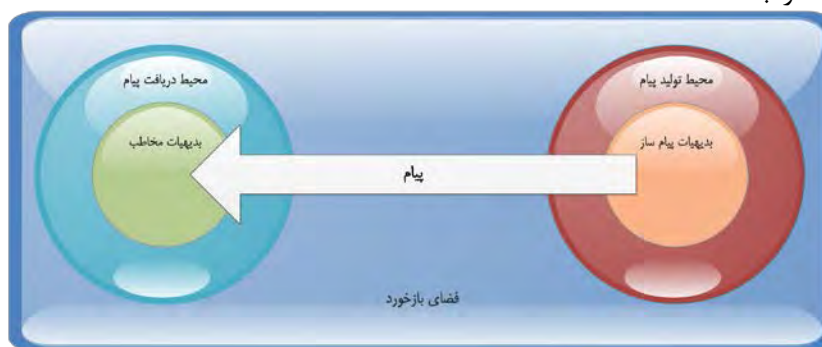
شکل ۲: مدل ارتباطی براساس بدیهیات فرهنگی

مخاطب از پیام نیز تحت سیطره بدیهیات فرهنگی وی قرار دارد. در این زاویه نگاه فرآیند ارتباط مملو از آموزش‌ها و یادگیری‌های پنهان است (نولن هوکسما، ۲۰۰۹) که بسیاری از آنها به صورت ناخودآگاه توسط ارتباط‌گر و مخاطب اتفاق می‌افتد. این موضوعی است که در بسیاری از نظریات کلاسیک مانند نظریه کاشت، نظریات هژمونیک و نظریه صنایع فرهنگی به آن اشاره شده و از این جهت می‌توان این نگاه را بسط داد.