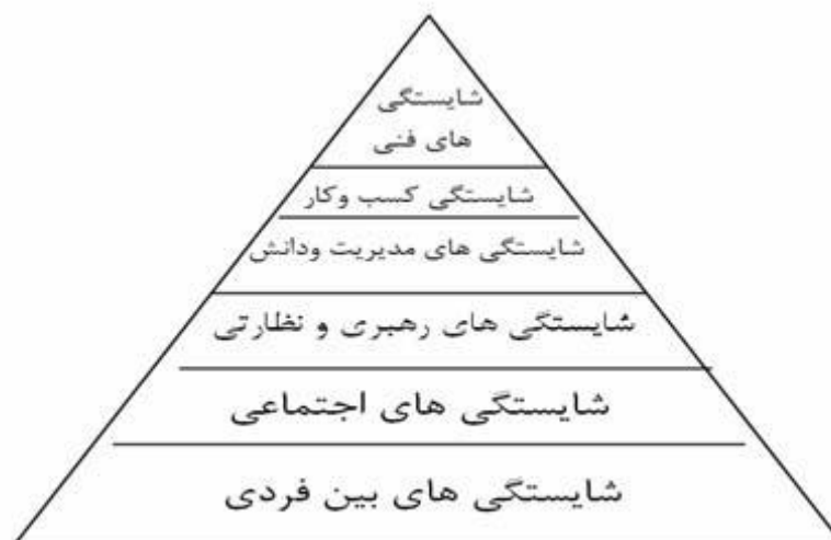
شکل ۲-مدل سلسله مراتب شایستگی های مدیریت (ویتالا، ۲۰۰۵)

در اینجا تلاش شد که فقط موارد اندکی از فهرست شایستگی ها از دیدگاه صاحب نظران و سازما نها بیان شود. با بررسی آرای صاحب نظران مشخص گردید که برخی از شایستگی ها، بیشتر مورد تأکید صاحب نظران قرار گرفته است. برای مثال، شایستگی ارتباطات، رهبری، خلاقیت، حل مسئله، مدیریت گروه، برنامه ریزی و تصمیم گیری از جمله شایستگی های مذکور هستند.