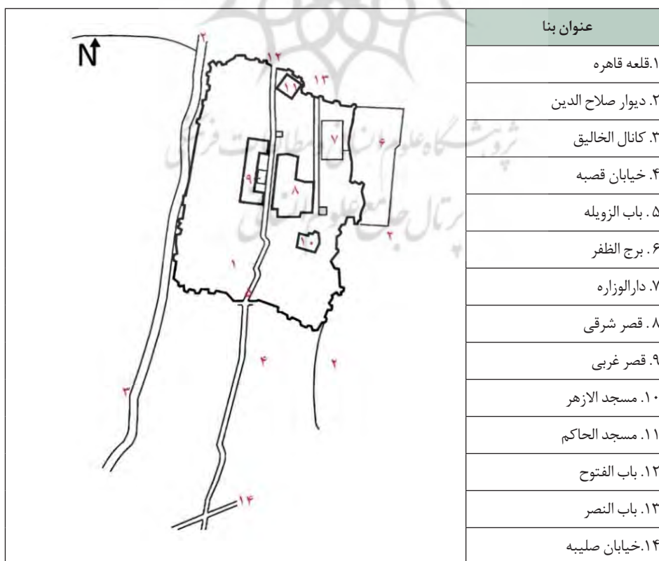
تصویر ۱. قلعه قاهره در زمان ایوبی بر روی نقشه ترسیمی از کارولین ویلیامز (۲۰۰۲) (جانمایی روی نقشه: نگارندگان)

در اواخر عهد ایوبی و هم‌زمان با روی کار آمدن مملوکان بحری به سال ۶۴۸ ه.ق.، هجوم مغولان به خاک ایران سبب می‌شود تا جمعیت عظیمی از مردمان از ترس مهاجمین، به مصر پناه ببرند (همان: ۱۵۳). این افزایش جمعیت باعث می‌شود تا مردمان بسیاری در پایتخت مصر سکنی گزینند و بدین سبب، قاهره بیش از پیش گسترده شده؛ به صورتی که از جنوب به شهر کهن فسطاط و از شمال به گورستان قدیمی می‌پیوندد (بلر و بلوم، ۱۳۸۱: ۲۲۰). در طی این دوره، فضای میان میدان بین‌القصرین به بهترین مکان جهت ساخت‌وساز بدل می‌شود. این ساخت‌وسازها به حدی متراکم هستند که