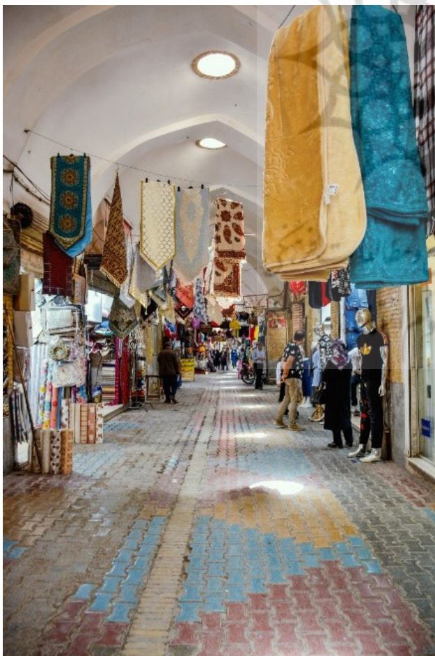
تصویر ۳. افول منظر مردمی بازار سمنان در نتیجه تضعیف نقش عملکردی و اقتصادی آن.

مناظر مردمی در شهرهای تاریخی ایران، به شکل خودجوش و تدریجی و به‌واسطه حضور مردم شخصیت یافته و بنابر مناسبات و قابلیت‌های عملکردی و معنایی فضا شکل گرفته‌اند (برقویی فرد و همکاران، ۱۳۹۹، ۲۴). با این وجود برخی از اقدامات صورت گرفته در راستای نوسازی بافت تاریخی، تنها به شکل‌گیری کالبدی باکیفیت و قابل استفاده ختم شده است. سرای نقش جهان در