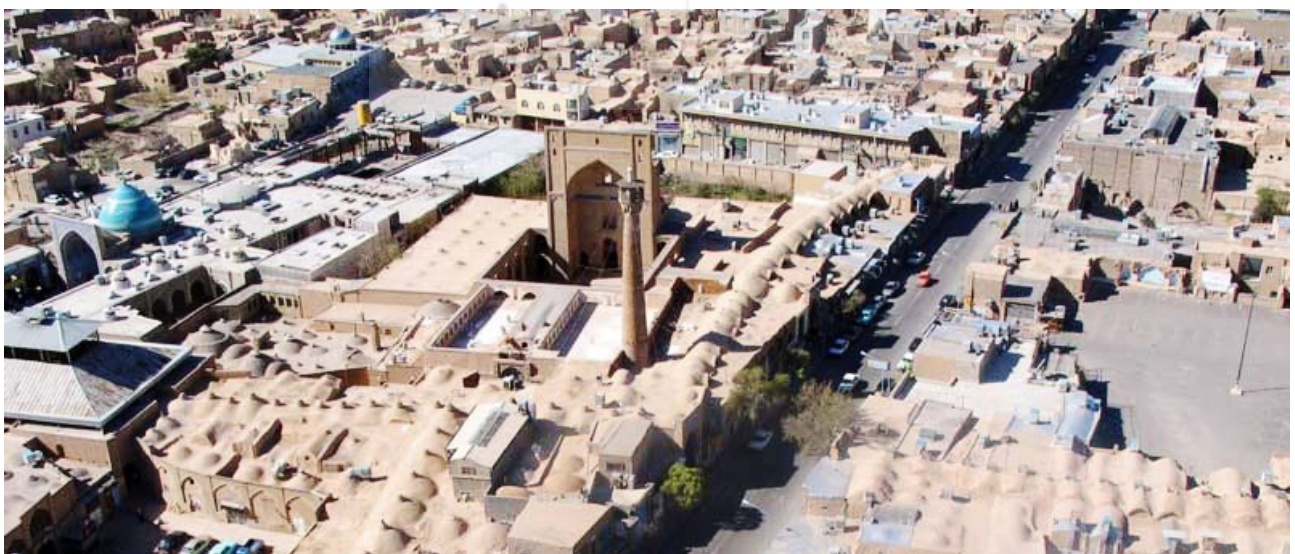
تصویر ۲. گسستگی بافت تاریخی سمنان و استقرار عملکردهای اصلی در مجاورت خیابان‌کشی‌های مدرن.

خیابان‌کشی؛ اولین مداخله کالبدی و تحول محیطی خیابان‌های نفوذی یکی از مهم‌ترین اقدامات مدرنیستی در تحول منظر شهرها محسوب می‌شوند که اغلب با هدف توسعه شهری، حمل‌ونقل و اتصال نقاط مهم در شهرها احداث شده‌اند. در دوره پهلوی اول خیابان‌کشی در همه شهرهای مطرح ایرانی از جمله سمنان و دامغان مورد استفاده قرار گرفت. در بخش مرکزی شهرهای سمنان و دامغان، خیابان‌کشی‌های مدرن بدون توجه به موجودیت درهم‌تنیده محلات، بافت شهر را از هم گسسته و وحدت معنایی و عملکردی بافت تاریخی و بازار و سازمان محله‌محور شهر را برهم زدند. به گونه‌ای که تا پیش از ایجاد خیابان‌ها در شهر دامغان، محلات شهری قابل تفکیک بوده و بازتابی از وحدت کاربردی و مدنی شهر بودند (فلامکی، ۱۳۶۸، ۲۵۳). با توجه به شناخته‌شدن محلات