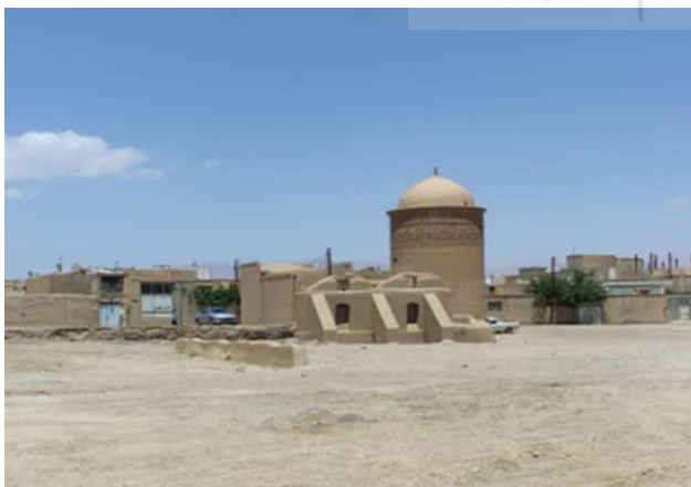
تصویر ۵. رویکرد موزه‌ای در حفظ بقعه پیر علمدار و حذف و تخریب بافت اطراف آن در محله خوریاب دامغان.