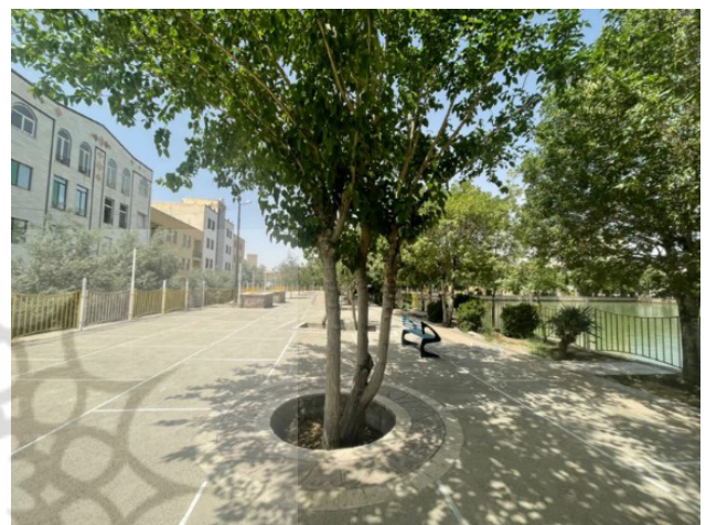
تصویر ۶. وجود نرده‌های فلزی بازدارنده و محدودماندن اقدامات به زیباسازی و محوطه‌سازی در استخر باغ‌فیض سمنان. عکس: نعیمه حشمتی، ۱۴۰۱.

چشمه‌علی دامغان یک منظر مردمی موفق با محوریت نقش ارزشمند عناصر طبیعی است که به‌عنوان سرچشمه تنها رود دائمی شهر دامغان، در فاصله ۳۰ کیلومتری شهر واقع شده