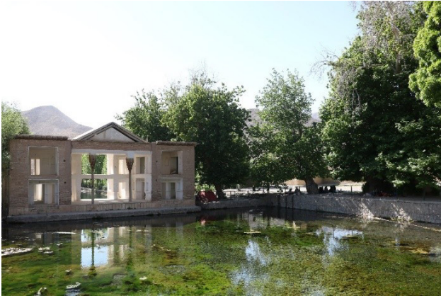
تصویر ۸. حضور مردم در کنار سه‌گانه منظر ایرانی در چشمه‌علی دامغان. عکس: مهدی نصیریان، ۱۴۰۱.

کل نگر، یکپارچه و چندوجهی برای افزایش دل‌بستگی شهروندان به مکان و رعایت تعادل در محافظت و مداخله در منظر، به حفظ عملکرد مناظر مردمی و به‌روزرسانی مداوم نحوه تفسیر کاربران از منظر کمک خواهد کرد (جدول ۱).