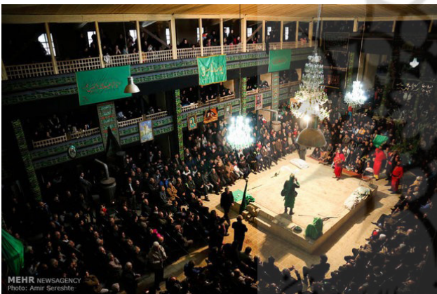
تصویر ۹. منظر مردمی برگزاری آیین‌های مذهبی و عزاداری‌ها تکیه ناسار در بازار تاریخی سمنان.