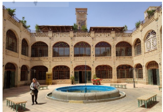
تصویر ۴. اقدامات صرفاً کالبدی در نوسازی سرای نقش جهان سمنان. عکس: شقایق گلشاهی، ۱۴۰۱.