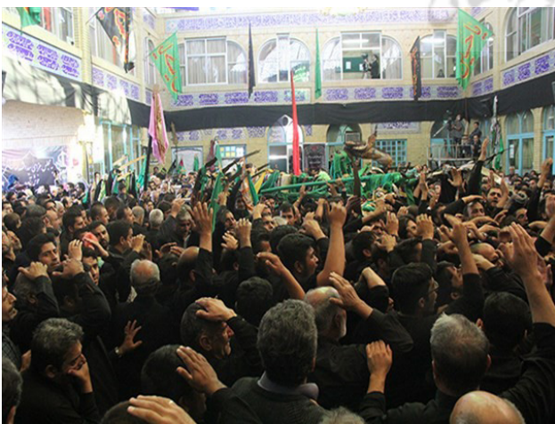
تصویر ۱۰. مراسم جامه‌کردن در تکیه حضرت ابوالفضل (ع) دامغان.

سنگ‌زنی و طوق جامه‌کردن در دامغان و سنت چادردوزی در سمنان از آیین‌های شناخته‌شده‌ای هستند که منظر مردمی خودجوش را در بافت تاریخی زنده نگه می‌دارند. برگزاری آیین‌ها در بازه‌های زمانی مشخص و خاطره برجامانده از آنها، منابع مهم هویت فردی و اشتراکی و مراکز عمیق تجربه انسانی را رقم می‌زند که حاصل همگرایی شناخت، تأثرات و رفتارهای مخاطبان در این اماکن هستند (تصاویر ۹ و ۱۰). باورها و آیین‌ها تأثیر مستقیمی بر شکل‌گیری سرمایه اجتماعی، هویت محلی و چگونگی مناظر مردمی دارند. توجه به نیازها و خواسته‌های مردم، نه تنها در نقش مخاطبان، بلکه عاملان اصلی شکل‌گیری کنش‌های انسانی و اجتماعی ضرورت دارد و مردم به‌عنوان مباشران اصلی، باید در محور تصمیم‌گیری‌های مرتبط با مناظر مردمی بافت تاریخی قرار گیرند. مفهوم مشارکت به‌عنوان اقدامی برای تحول رویکرد مدیرمحور به رویکرد مردم‌محور و اولویت‌بخشی به خواسته‌ها و ذهنیات مردم به‌عنوان یکی از ذی‌نفعان اصلی در این زمینه مورد توجه است (مجیدی، منصوری، صابر نژاد و براتی، ۱۳۹۸، ۱۴۰۰).