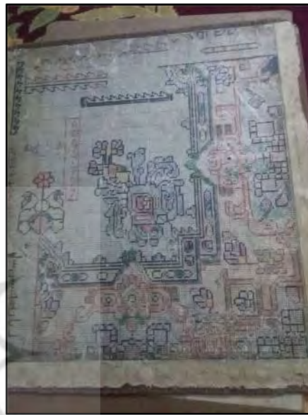
تصویر ۵: نمونه‌ای از نقشه به‌دست‌آمده از خانه بافندگان (نگارنده اول)