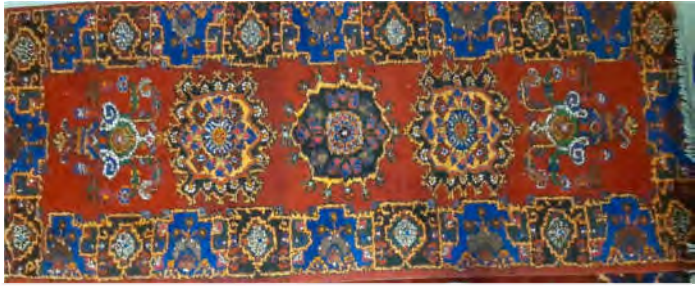
تصویر ۱۶: قالی با طرح ترنجی ارسک (نگارنده اول)

طرح و نقش و تجربیات بافت قالی در این مناطق با یکدیگر فراهم کرده است.