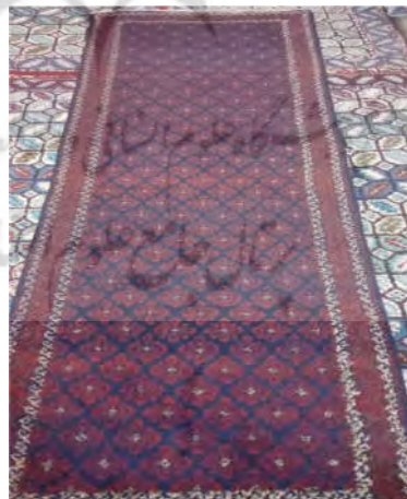
تصویر ۱۳: قالی با نقشه عربی