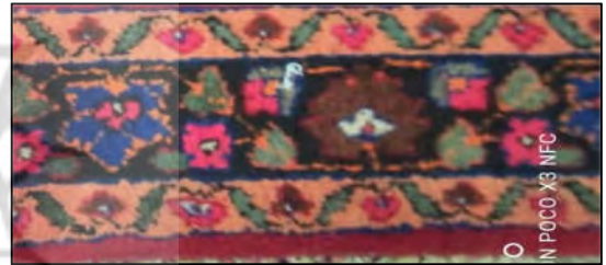
تصویر ۲۱: انواع حاشیه ساده (نگارنده اول)