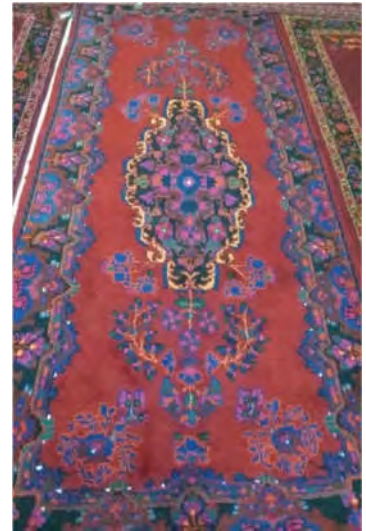
تصویر ۹: قالی ترنجی گوری (نگارنده اول)