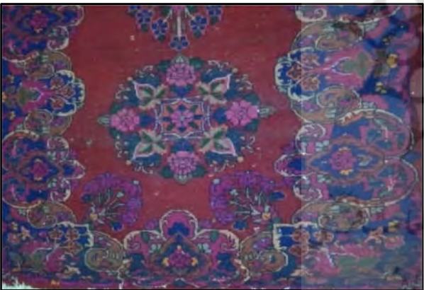
تصویر ۱۸: حاشیه چرکی (نگارنده اول)

این طرح متشکل از سه ترنج در طول قالی و دو سرترنج بزرگ است که سرترنج‌ها به ترنج‌های ابتدا و انتهای قالی متصل شده‌اند. طرح ترنجی ارسک دارای حاشیه‌ای مختص به خود است (تصویر ۱۶).