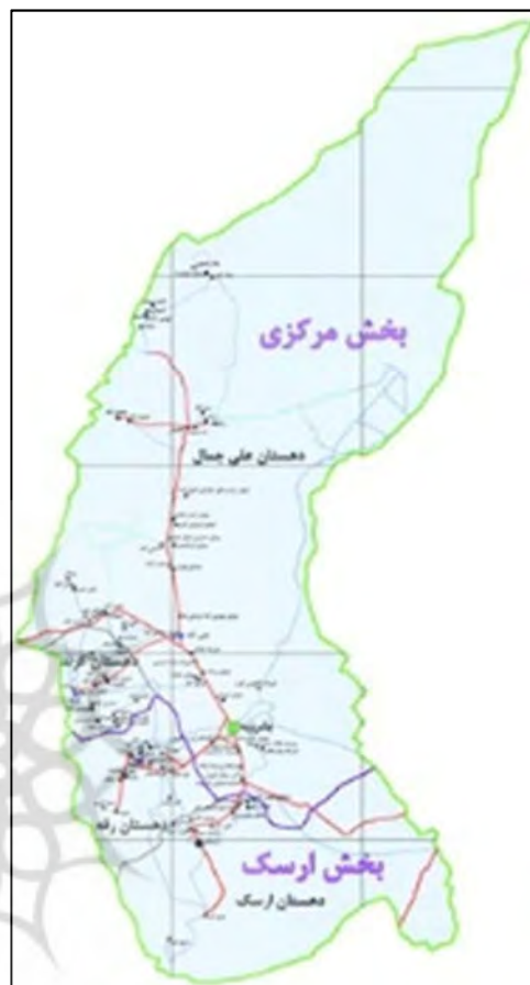
تصویر ۲: نقشه تقسیمات شهرستان بشرویه