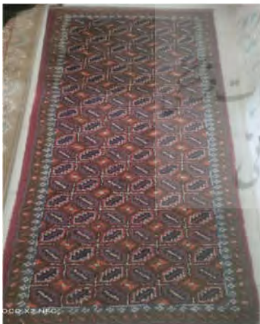
تصویر ۱۴: قالی با نقشه ماهی (نگارنده اول)