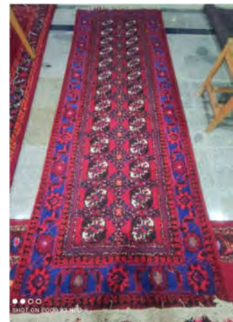
تصویر ۱۲: قالی با طرح ترکمنی (نگارنده اول)