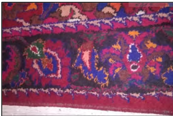
تصویر ۱۹: حاشیه مشهدی (نگارنده اول)

این حاشیه که مانند حاشیه واژ در زیرمجموعه حاشیه‌های سرخود یا درباری طبقه‌بندی می‌شود، متشکل از یک واگیره تکرارشونده است که مزین به گل‌های لاله‌عباسی برگ‌مویی، گل‌فرنگ رز و برگ‌های کنگره‌ای شکل است (تصویر ۱۸). در برخی از نقشه‌ها یک دسته گل‌فرنگی و رشویی با نام محلی «گل پیرمرد» از گوشه حاشیه منشعب شده و در محل لچک قرار گرفته است. با توجه به آنکه طرح و نقش این حاشیه دورنمایی از چروکیدگی را در ذهن تداعی می‌کند، در گویش و زبان محلی با نام «چرکی» به معنای چروک و چروکیدگی خوانده می‌شود.