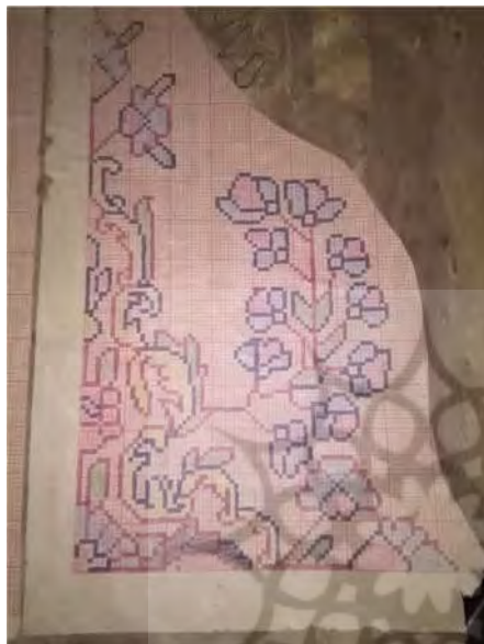
تصویر ۶: نمونه‌ای از نقشه به‌دست‌آمده از خانه بافندگان (نگارنده اول)

حفظ می‌شدند و حفظی‌بافی را با نام ذهنی‌بافی مطرح می‌کردند. به‌علاوه طی تحقیقات میدانی تعداد زیادی نقشه‌قالی در خانه‌های بافندگان به دست آمد که از روی نقوش قالی‌های دیگر کپی‌برداری شده بودند (تصاویر ۵ و ۶). مجموع داده‌های به‌دست‌آمده حاکی از آن است که بافندگان نقشه‌های جدید را از پشت قالی‌ها خوانش می‌کردند یا آن‌ها را بر روی کاغذ پیاده کرده، طبق ذوق و سلیقه خود می‌بافتند. به‌مرور زمان نیز با تکرار بافت مجموعه‌ای از نقشه‌ها را حفظ می‌شدند و به‌صورت حفظی یا ذهنی می‌بافتند و به نسل بعدی آموزش می‌دادند. معروفیت طرح‌ها و نقوش رایج در منطقه بشرویه معمولاً بر پایه ساختار طرح و نقش، مانند قالی ترنجی خوشه‌انگوری یا سرمنشأ طرح‌ها و نقوش، مانند نقشه‌عربی و نقشه‌ترکمانی بوده است. بر این اساس می‌توان طرح‌ها و نقوش رایج در متن و حاشیه‌قالی‌ها را طبقه‌بندی و بررسی کرد (جدول ۳).