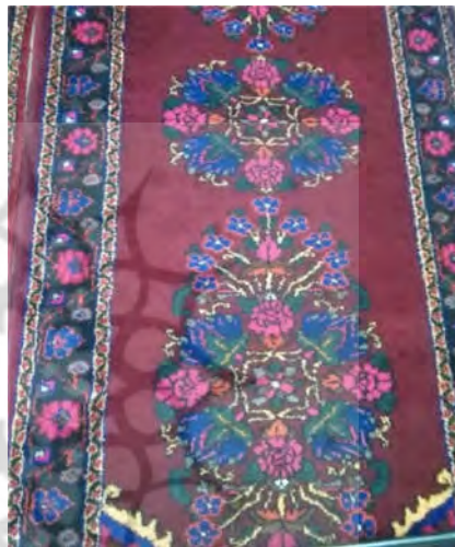
تصویر ۷: قالی ترنجی نه‌گلی (نگارنده اول)