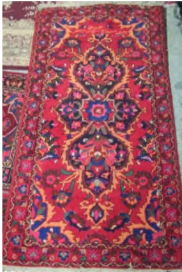
تصویر ۱۱: قالی لچک ترنج (نقشه جدید) (نگارنده اول)