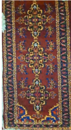
تصویر ۱۰: طرح ترنجی خوشه انگوری (طوافی، آرشیو شخصی)