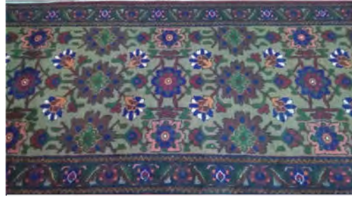
تصویر ۱۵: قالی با طرح شاهعباسی ارسک (نگارنده اول)