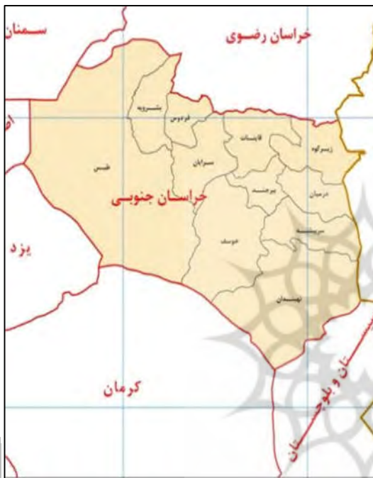
تصویر ۱: موقعیت جغرافیایی شهرستان بشرویه در استان خراسان جنوبی

شهرستان بشرویه به مرکزیت شهر بشرویه در شمال غرب استان خراسان جنوبی واقع شده که از شمال با شهرستان بردسکن (استان خراسان رضوی)، از جنوب و غرب با شهرستان طبس و از شرق با شهرستان فردوس همجوار است (تصویر ۱). این شهرستان یکی از مناطق بافت قالی در استان خراسان جنوبی است که با توجه به شرایط اقلیمی آن، طی یکصد سال گذشته تولید قالی نقش مهمی در اقتصاد خانوارهای منطقه داشته است. شیوه متداول و سنتی بافت قالی در بشرویه، تولید قالی‌های کوچک پارچه بر روی دارهای افقی با سبک روستایی بوده که امروز تولید آن به حداقل ممکن رسیده است؛ به طوری که اکثر بافندگان جوان‌شناختی از قالی‌های اصیل منطقه نداشته و بیشتر به بافت قالی‌هایی با سبک شهری و طرح‌های به اصطلاح نایینی روی آورده‌اند.