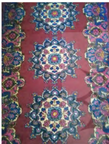
تصویر ۸: قالی ترنجی گرد (چرخ چاهی) (نگارنده اول)

این طرح شامل ترنج گرد شانزده پر است که یک گل چند پر در میانه آن و هشت گل فرنگ و گل شاه‌عباسی به‌صورت یک‌درمیان در اطراف آن قرار گرفته و برگرفته از نقش ترنج در طرح «ترنجی ارسک» است. این طرح با توجه به شباهت ترنج آن به چرخ چاه، با نام محلی «چرخ چاهی» نیز شناخته می‌شود. در این طرح، چند ترنج در راستای محور طولی قالی تکرار شده و در برخی نمونه‌ها با توجه به طرح حاشیه، چهار لچک نیز مشاهده می‌شود که معمولاً لچک‌ها یک‌چهارم نقش ترنج هستند. این طرح نیز مانند طرح ترنجی نه‌گلی مبتنی بر تکرار چند ترنج در متن قالی، بر روی زمینه‌ای ساده و بدون نقش است (تصویر ۸).