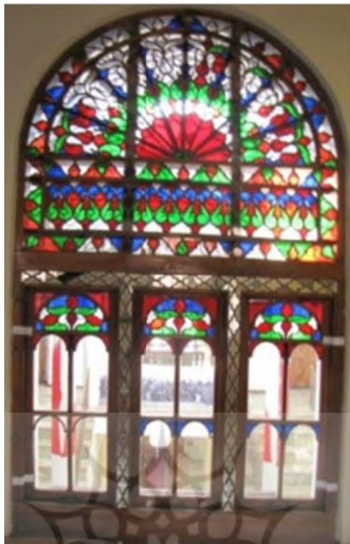
تصویر ۳: نمونه‌ای از ارسی‌های خانه مشروطه تبریز.