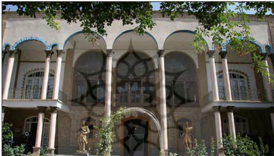
تصویر ۲: نمایی از مجسمه‌های حیاط خانه مشروطه تبریز.

خانه مشروطه خود نوعی سمبل مقابله با حکومت استبدادی محسوب می‌شود که ملجئی برای گردهم آمدن مشروطه خواهان بود. این خانه در ناحیه مرکزی شهر و در ضلع غربی بازار تاریخی شهر تبریز در محلی به نام راسته کوچه واقع است که در کنار بناهای منفرد متعددی همانند مسجد جامع شهر قرار دارد. این بنا توسط معمار تبریزی به نام «حاج ولی معمار» است. تاریخ ساخت این بنا سال ۱۲۴۷ ه.ق است. این خانه مانند تمام خانه‌های ایرانی، پس از ورودی اصلی وارد هشتی شده که این هشتی با بدنه‌های آجری و پوشش‌های کاربردی آجری پوشانده شده است. در سمت حیاط یک ایوان ستون با ارتفاع دو طبقه، نمای جنوبی را از بارندگی در پناه گرفته است. این خانه به علت اهمیت تاریخی و شیوه معماری سنتی بنا در سال ۱۳۵۴ به شماره ۱۷۱/۹ در فهرست آثار ملی ایران به ثبت رسید و در سال ۱۳۶۷ توسط سازمان میراث فرهنگی خریداری شد.