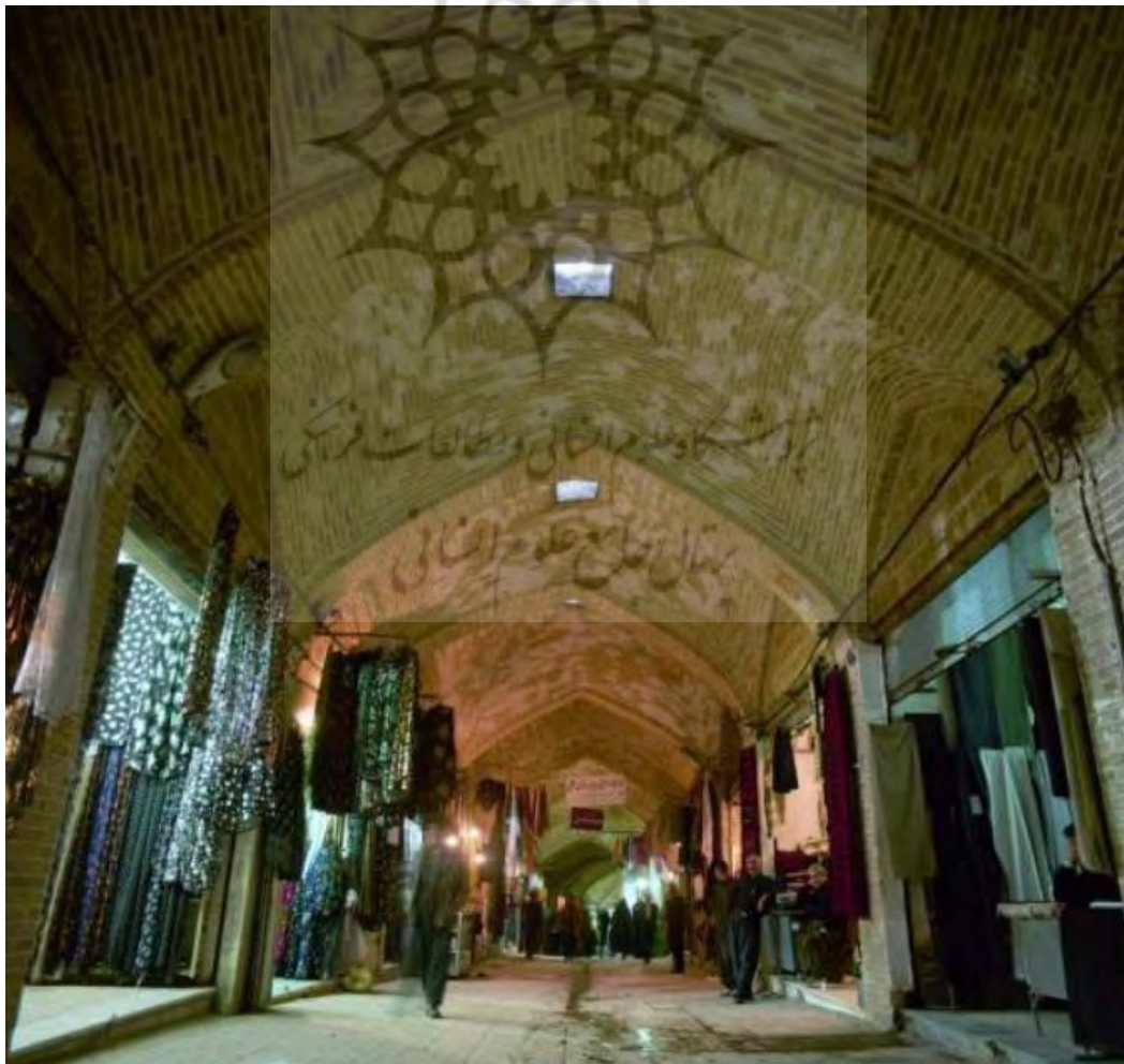
تصویر ۱: نمایی از دلان اصلی بازار سنتی کرمانشاه، مأخذ: (مرادی و همکاران، ۲۰۱۶).

احساسات، یکی از مهمترین مؤلفه‌هایی است که همه بازدیدکنندگان برای ارتباط برقرار کردن با چنین فضایی بیان کرده‌اند و بر این عقیده‌اند، که راه فهم و آمدن به چنین مکانی، کانال احساس و عواطف است که در خوانش آنها از این مکان بسیار مهم است. راه درگیر شدن آنها با بنا و ماندن در محیط، پابند کردن احساسات آنها در این فضا است. شاید بتوان گفت که آرامش و احساسات خوبی که افراد از محیط بازار می‌گرفتند، دلیلی برای برگشتن و یا ترک کردن، آن محل است. این احساسات است که حلقه رابطه انسان و محیط می‌شود و تأثیری که این محیط در عمق وجود فرد به جای می‌گذارد، به مراتب از منطق و تحلیل، بالاتر است. تصویر شماره (۱) نمایی از بازار سنتی کرمانشاه را منعکس ساخته که بدون تردید نخستین ویژگی کالبدی آن تلقین حس امنیت است.