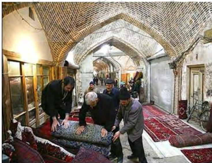
تصویر ۲: نمایی از درون بازار سنتی کرمانشاه.

بنای تاریخی و استفاده از المان‌ها و نشانه‌های سنتی، به نوعی یادآور گذشته‌ای است که به باور بسیاری از ایرانی‌ها امروزه، رنگ باخته است و دیگر نشانی از آن قدرت و بزرگی و شکوه نمی‌بینند. بسیاری از معماری‌هایی که در دوره گذشته و قبل از انقلاب ساخته شده‌اند، همگی سعی بر بازنمایی این گذشته داشته‌اند و از این بناها الگو گرفته‌اند. یکی از توفیقات چنین فضاهایی در جلب توجه بازدیدکنندگان، حفظ اصالت و فرهنگ و پیدا کردن هویت گم‌شده‌ای است که دیگر نشانی از آن نمی‌بینند. از افراد آنچنان لذت‌بخش است که جز جز این مجموعه برای شان حکایت از داستان نقشه‌کش قابلی است که همه چیز را به تناسب در کنار هم قرار داده است. این همخوانی و هم‌نوایی بین عناصر و اجزای مختلف بنا از یک سو و طبیعت بیرونی از سوی دیگر، چنان باعث انبساط خاطر می‌شود که می‌تواند چشمان هر فردی را مبهوت خود کند. تصویر شماره (۲) می‌تواند تصویرگر عناصر تأثیرگذار بر شور و احساسات بازدیدکنندگان از بازار باشد.