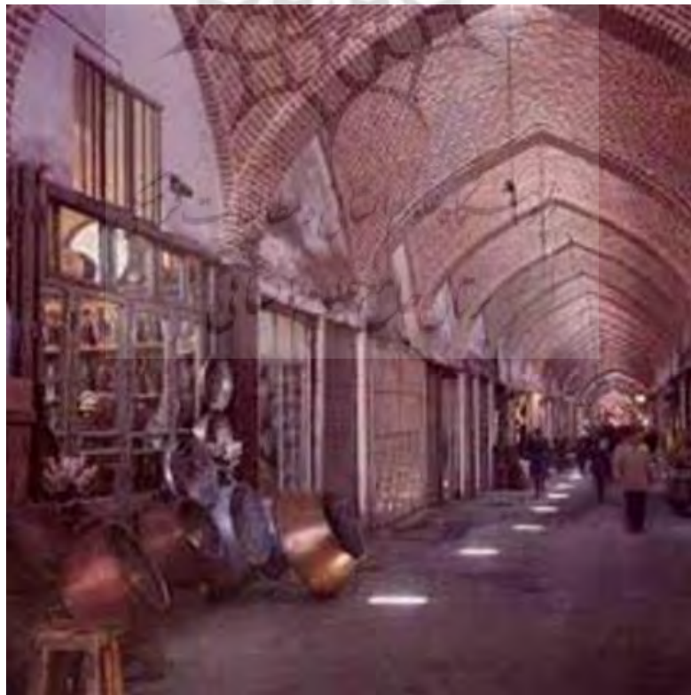
تصویر ۳: نمایی از بازار سنتی کرمانشاه، مأخذ: (مرادی و همکاران، ۲۰۱۶).

این عناصر ذکر شده در معماری سنتی و طبیعی بازار چنان جذابیت و گیرایی دارند، از چنان روح و معنایی لبریز هستند که با ذهنیت بازدید کننده همخوان می‌شوند و چیزی که وی از بنا می‌خواهد را با خود همبسته می‌داند و در تلاش است تا خود را با آن یکی کند. این همبستگی بین فضای سنتی و آرامشی که فرد از آن می‌گیرد، مصنوع و القایی نیست، بلکه از عناصری است که در یک کلیت بازار وجود دارد و فرد را به خود جذب و در مسیری که فرد در طول بازار طی می‌کند با وی عجین می‌شود و خود را با فضای مکانی این بنا همخوان می‌داند. تصویر (۳) که نمای دیگر از بازار سنتی کرمانشاه است که همبستگی کالبدی فضا با محیط را نشان می‌دهد.