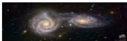
دو کهکشان مارپیچی در رقصی کیهانی

«فعل و انفعالات دینامیک ذرات که سازنده‌ی جهان مادی هستند، با حرکات موزونی در نوسان است و به‌این ترتیب عالم کبیر در یک حرکت بی‌پایانی درگیر و در رقص انرژی موزونی گرفتار است» (کاپرا، ۱۳۸۵: ۲۲۹). عطار هم در بیان تکامل هستی و سریان عشق در همه‌ی اجزای کاینات، در اسرارنامه مفصل به گردش منسجم هستی از ذره تا افلاک می‌پردازد که تا ابد حلقه‌زنان به رقص و سماع عاشقانه می‌پردازند (رک. اسرارنامه ، ۱۳۹۲: ۱۶۳ و ۱۶۴):