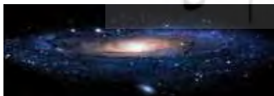
رقص باشکوه کیهانی

تصویر زمین در حرکت (نقطه‌ی قرمز) در کهکشان راه شیری حرکت مرغان جهان به سوی سیمرغ در کتاب تائوی فیزیک ، در زمینه‌ی شباهت‌های میان فیزیک معاصر و تصوف شرق آمده است: «عالم کبیر از نظر عرفان شرق، بافته‌ای پیچیده است که تاروپودش پویا و نیروسرسشت است. ذره طبق تئوری کوانتوم، پیوسته در حرکت است که خصیصه‌ی جهان زیراتمی است؛ عالم کبیر هم موزون، هماهنگ و در جنب‌وجوش است» (کاپرا، ۱۳۸۵: ۱۹۶) در تصویر جدید دریافتی از ماهواره‌های فضایی «دنیای ما را می‌توان به حبابی شناور در اقیانوسی بزرگ تشبیه کرد که حباب‌های جدید در تمام مدت، در آن درحال شکل‌گیری هستند» (کاکو، ۱۳۹۵: ۱۶). در اندیشه‌ی عرفانی شاعر ما نیز جهان ما حباب (کوبله) روی آب دریا را می‌ماند که پیوسته در حال شکل‌گیری هستند (رک. عطار، ۱۳۸۹ الف: ۲۳۹).