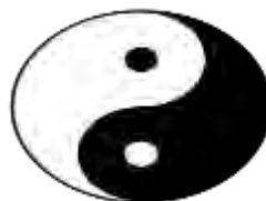
یینگ یانگ، نماد تمامیت اصول متضاد در کیهان

فیزیک نوین «جهان را به گروه‌های ارتباطی متفاوت تقسیم می‌کند که در آن ارتباطات مختلف با هم مبادله، یا همدیگر را پوشانده و یا درهم تلفیق می‌شوند و به این ترتیب بافت کل را معین می‌کنند» (Heisenberg, 1958: 77).