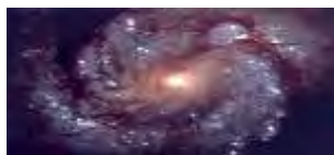
جهان مارپیچی شکل در حرکت