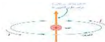
چرخش الکترون به دور هسته‌ی اتم