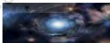
کهکشان در گردش