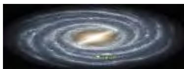
کهکشان مارپیچی شکل در حرکت

بنابراین حرکت و سیر دورانی در توصیف یگانگی سی مرغ با سیمرغ در ابیات پایانی منطق‌الطیر، طبعاً شکلی دایره‌ای را به وجود می‌آورد که هم نماد یکپارچگی است و هم می‌تواند به حرکت عالم کبیر اشاره داشته باشد؛ عالمی که خصیصه‌ی آن تا ابد در حرکت بودن است که آن را «زندگی» تعبیر می‌کنند. درضمن در این حرکت دایره‌ای سی مرغ تکامل یافته و با سیمرغ یکپارچه شده است. واژگان متقارن سی مرغ و سیمرغ (جناس مرکب) در این تصویرسازی و تجسم یک تجربه‌ی غیر انسانی برای درک و دریافت مخاطب، کمک فراوانی به شاعر کرده‌اند.