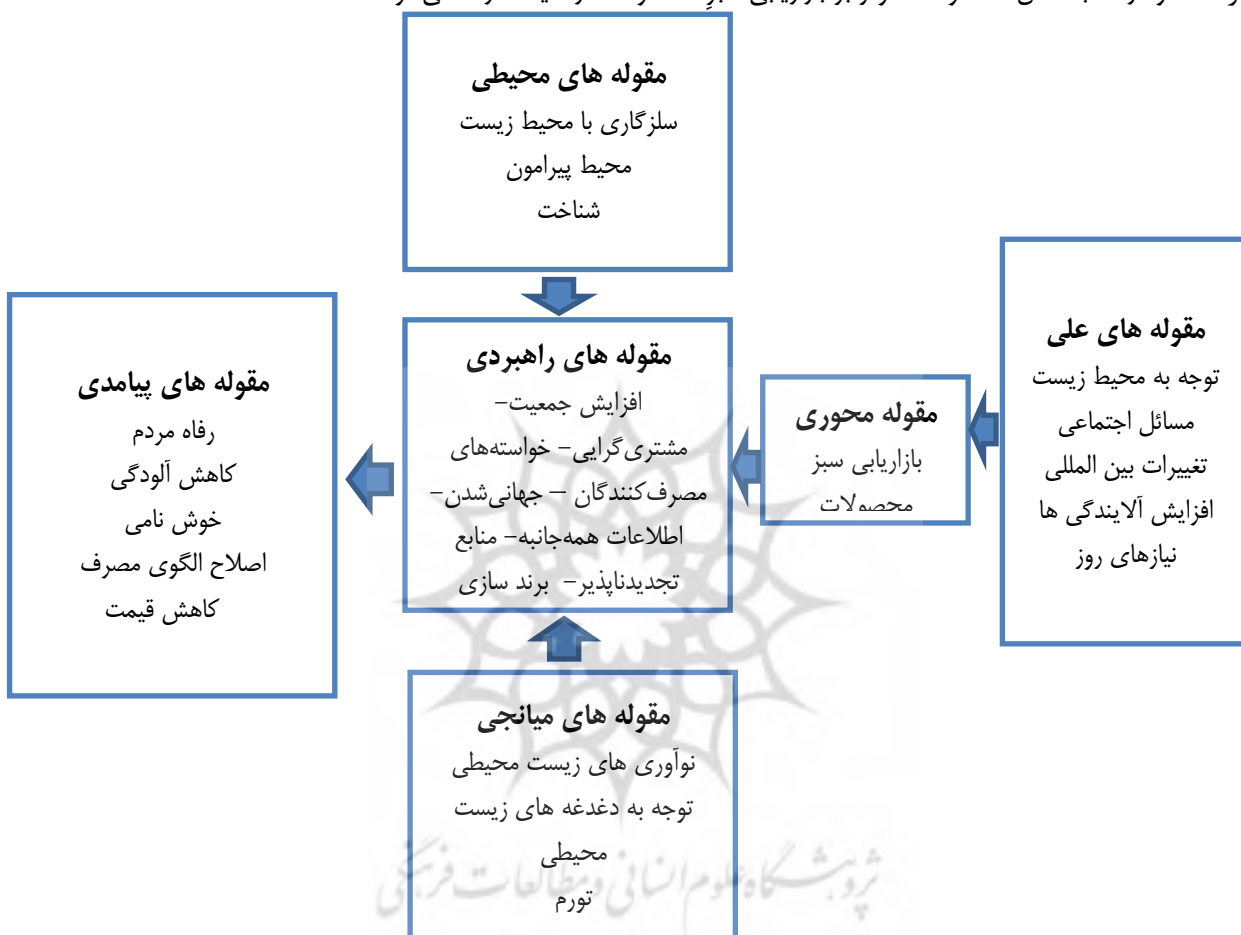
شکل شماره (۲): مقولات موثر بر بازاریابی سبز محصولات ارگانیک

در ادامه و در قالب شکل ۲، مقولات موثر بر بازاریابی سبز محصولات ارگانیک، ارائه می‌شود.