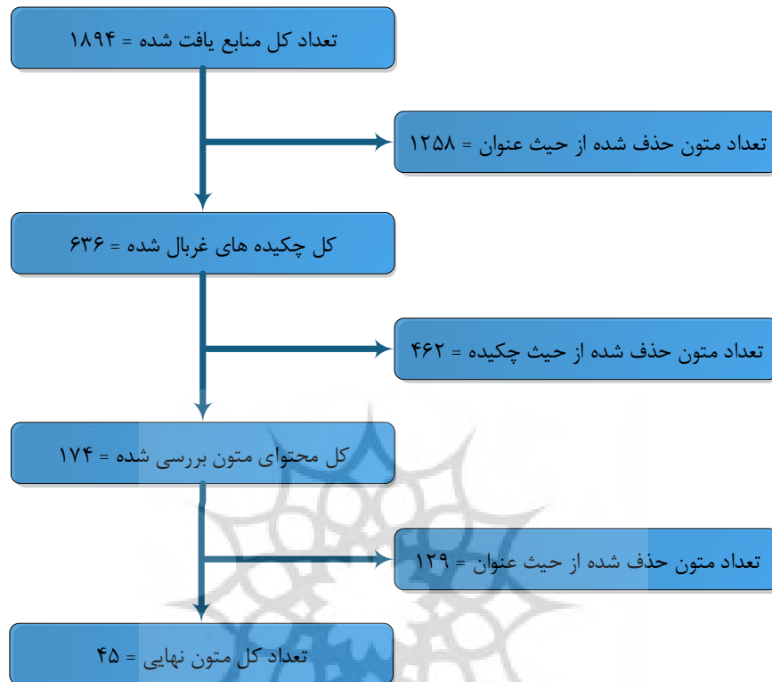
شکل ۲: نمودار روندنما برای انتخاب آثار مناسب برای تحلیل

پرداخته شد و با بررسی چکیده‌ها هم تعدادی از منابع بی‌ربط، حذف شدند. در گام بعدی، منابع تصفیه شده بر اساس چکیده به صورت متن کامل بررسی گردیدند و در این بررسی هم تعدادی از منابع از لحاظ محتوا حذف شدند. منابع باقی مانده پس از بررسی محتوا در پژوهش و تحلیل نهایی مورد استفاده قرار گرفتند.