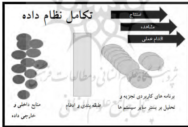
شکل ۱: تکامل نظام داده

ادبیات آن و نحوه بکارگیری آن در حرفه را مورد توجه قرار داده است، حال آنکه از نکات کلیدی قابل توجه در این زمینه شناسایی عواملی است که می‌توانند زمینه گسترش اینگونه تکنولوژی‌ها را در بازار محدود اما رو به رشد حسابرسی در ایران، تقویت نمایند. برخی از عوامل بررسی شده در این پژوهش شامل عوامل مثبتی است که موجب گسترش و بکارگیری بزرگ داده‌ها در ایران خواهند بود. یکی از عوامل کلیدی از جانب مثبت‌اندیشان وجود استانداردهای حسابرسی مصوب است که توانایی تصویب و ابلاغ را به قانون‌گذاران می‌دهد. با انتشار استاندارد حسابرسی بزرگ داده‌ها عملیات‌های اجرایی حسابرسی با دقت، کیفیت و ثبات بالایی صورت خواهد پذیرفت. همچنین، وجود استاندارد حسابرسی در این زمینه دارای ارتباطی دو سویه با پیدایش، گسترش و استفاده از بزرگ داده‌ها است. از یکسو نقش مثبت وجود استاندارد و دستورالعمل‌ها انکارناپذیر است و از سوی دیگر، تصویب استاندارد، اختیار عمل در استفاده تکنولوژی‌ها توسط حسابرسان را با محدودیت‌هایی مواجه خواهد نمود. از دیگر عوامل مثبت موجود که بستر استفاده وسیع از تکنیک‌های بزرگ داده‌ها در حسابرسی را تقویت می‌کند، وجود رهنمودهایی است (به عنوان مثال رهنمود درک و حسابرسی بزرگ داده‌ها منتشر شده توسط انجمن حسابرسان داخلی آمریکای شمالی) که به آموزش حرفه‌ای شاغلین می‌پردازد. شکل ۱ تکامل نظام داده‌ها را نشان می‌دهد.