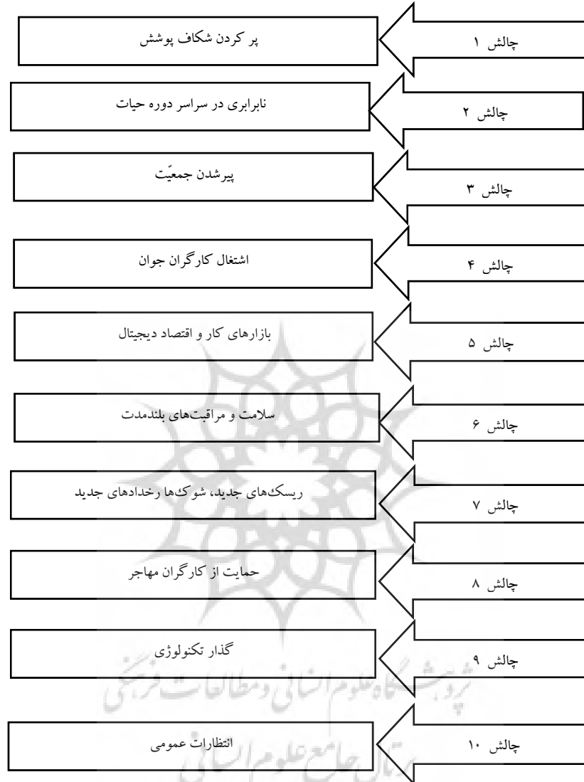
شکل (۲): ۱۰ چالش جهانی تامین اجتماعی