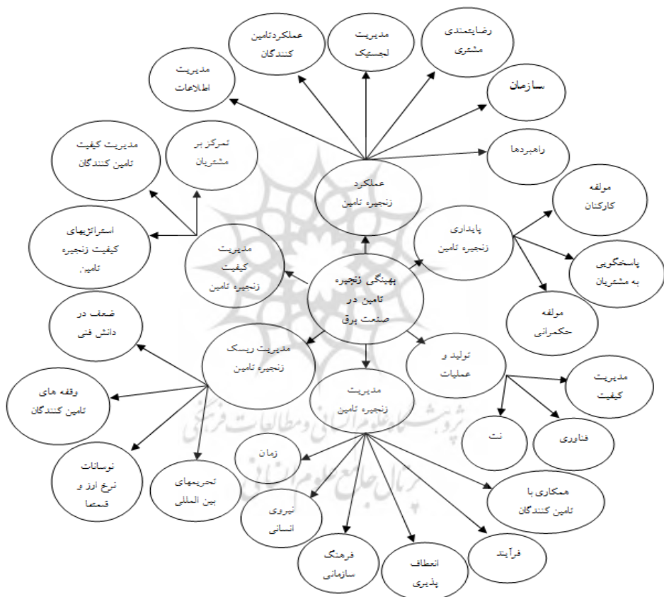
شکل ۱: الگوی کیفی بهینگی زنجیره تأمین در صنعت برق

هدف اول: شناسایی عوامل مؤثر بر بهینگی زنجیره تأمین. هدف دوم: سطح‌بندی و تعیین روابط عوامل مؤثر بر بهینگی زنجیره تأمین. با جمع‌بندی نظرات صاحب‌نظران، مبانی نظری و پژوهشی، الگوی کیفی بهینگی زنجیره تأمین در صنعت برق دارای شش بعد به‌صورت زیر طراحی شد.