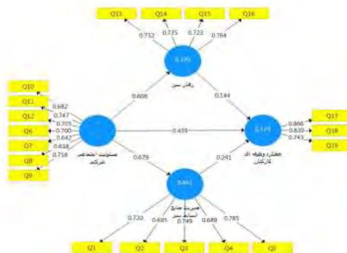
شکل ۲. ضریب مسیر و بار عاملی مدل مفهومی پژوهش

سطح اطمینان ۹۹ درصد باشد، فرضیه پژوهش معنادار می‌گردد، در غیر این صورت فرضیه رد می‌شود. شکل ۳ نشان دهنده مقدار آماره (t-value) مدل مفهومی پژوهش است.