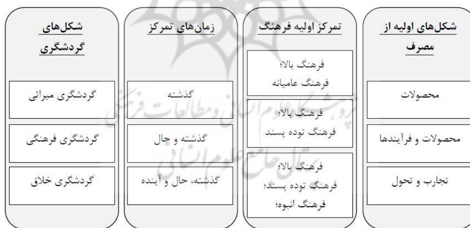
شکل (۲). ویژگی‌های گردشگری فرهنگی در کنار میراث فرهنگی و گردشگری خلاق

با این حال بیشتر موارد ذکر شده مبتنی بر محصول است (OECD, 2009). به همین دلیل به هیچ طریقی نمی‌توان جلوی کالایی شدن فرهنگ را گرفت چرا که در اهمیت نقش محصولات فرهنگی در توسعه گردشگری جهت کسب سود بالاتر در مناطق مختلف هیچ شکی وجود ندارد. تجارب فرهنگی می‌تواند منجر به افزایش محصولات فرهنگی و همچنین جذب گردشگران جدید به منطقه شود که در این صورت جذب بازدیدکنندگان بر اساس عوامل انگیزشی مبتنی بر فرهنگ صورت می‌گیرد. گزارش سازمان همکاری اقتصادی و توسعه سازمانی در سال ۲۰۰۹ که نشان‌دهنده تأثیر فرهنگ بر روی گردشگری است، بیان می‌کند که گردشگری فرهنگی می‌تواند نقش عمده‌ای در توسعه مناطق مختلف، گرد هم آوردن مردم با سنت‌های متعدد و به اشتراک‌گذاری آداب و رسوم و ارزش‌ها داشته باشد. یکی از مهم‌ترین مشکلات در این زمینه از نظر راج این است که: اصطلاح «فرهنگ» به شدت در طول دو دهه گذشته مورد بحث قرار گرفته و هیچ تعریف روشن و مورد قبولی از مفهوم آن توسط جامعه به عنوان یک کل نشده است. این مورد ارتباط نزدیکی با هویت ملی ما دارد که مردم را در سازمان‌های اجتماعی، محلی و ملی مانند دولت‌های محلی، نهادهای آموزش و پرورش، جوامع مذهبی، کار و فراغت و تفریح قرار می‌دهد (Raj, 2012)؛ در نتیجه در چنین شرایطی چگونه فرهنگ می‌تواند یک ابزار و اهرمی در توسعه گردشگری محسوب شود. پس اولین گام در توسعه گردشگری فرهنگی در یک جامعه، تعریف روشنی از فرهنگ آن جامعه و محصولات فرهنگی آن است. رایج‌ترین روش صورت گرفته در برخورد با گردشگری فرهنگی کاهش ناملموس یک محصول در بازار و ایجاد تمایز بین محصولات و تبدیل آنها به محصولات مختلف و مرتبط با مفاهیم گردشگری میراث فرهنگی، گردشگری فرهنگی و گردشگری خلاق است. شکل (۲).