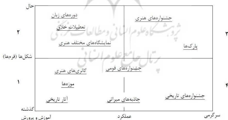
شکل (۱). گونه‌شناسی از جاذبه‌های گردشگری فرهنگی

ارتباط گردشگری و فرهنگ در حال تبدیل شدن به یک امر طبیعی و عادی است. بسیاری از ابعاد گردشگری معاصر عناصر فرهنگی هر جامعه را ارائه می‌دهند. شکل (۱) به لحاظ بصری بازنمایی مفیدی توسط ریچاردز از یک محیط گردشگری فرهنگی را نشان می‌دهد. در این شکل، دو مقیاس - اشکال گذشته / حال و عملکرد / آموزش و پرورش / سرگرمی - را تشکیل می‌دهند که شامل طیف گسترده‌ای از محصولات فرهنگی تا آنچه که برای گردشگران اجرا می‌شود؛ مانند صحنه جشنواره‌ها و همچنین فرم‌هایی که می‌تواند تقریباً تحرکی برای صنعت گردشگری باشد که نمایشگاه‌های هنری و دوره‌های زبان را در بر می‌گیرد.