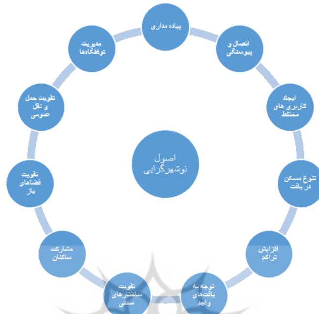
شکل (۱). اصول نوسازگرای.