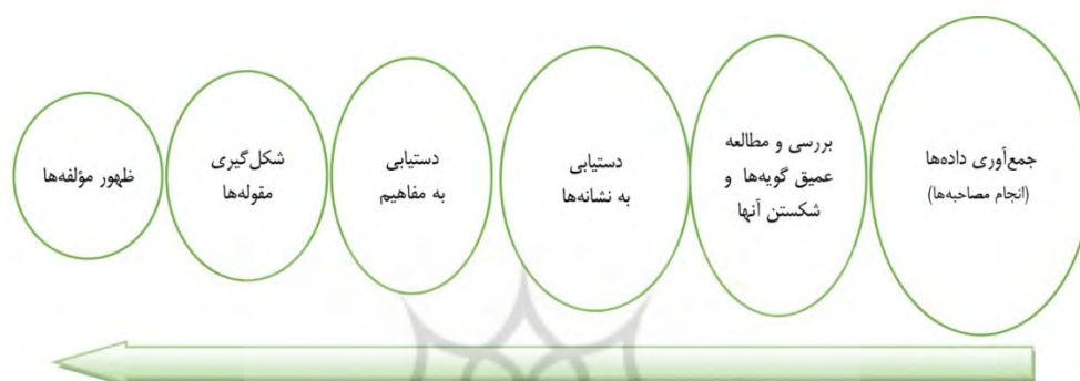
شکل ۱. مراحل (فرایند) کُدگذاری داده‌ها برای دستیابی به مؤلفه‌ها

روش‌های کیفی استراتژی‌های متفاوتی دارند. در این پژوهش از استراتژی داده‌بنیاد برای شناسایی مؤلفه‌های کیفیت حسابرسی مستقل با تأکید بر رفع نیازهای ذی‌نفعان، استفاده گردیده است. براین اساس، بلافاصله پس از انجام هر مصاحبه، متن آن به‌روش سطر به سطر ۱ و به‌منظور جدا کردن گویه‌ها (شکستن داده‌ها) خوانده شد. در گام بعد، بررسی و مطالعه عمیق گویه‌ها منجر به دستیابی به نشانه‌ها شد. نشانه‌ها نیز مفاهیم را خلق کردند و در نهایت، مقوله‌های اصلی شکل گرفتند. پس از طی مراحل (فرایند) مذکور، مؤلفه‌ها ظاهر شدند. مراحل (فرایند) کُدگذاری داده‌ها برای دستیابی به مؤلفه‌های موضوع پژوهش (براساس رویکرد استقرایی) در شکل ۱ نمایش داده شده است: