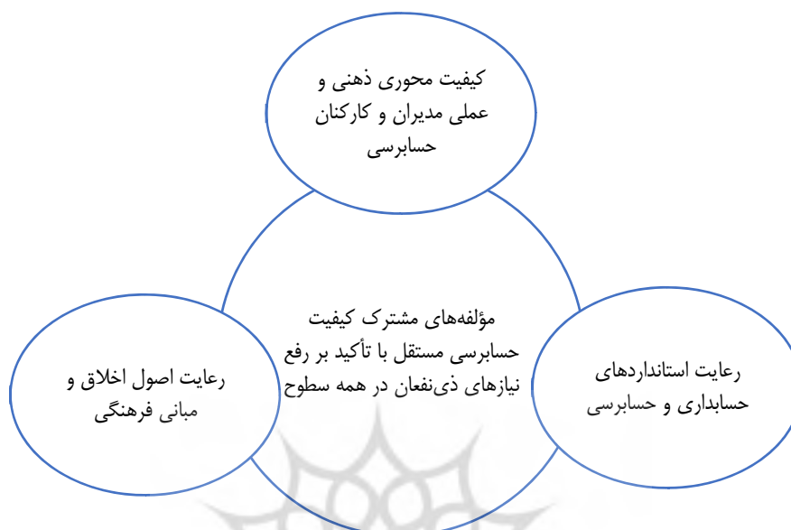
شکل ۳. مؤلفه‌های مشترک کیفیت حسابرسی در همه سطوح

مدیران و کارکنان حسابرسی و رعایت استانداردهای حسابداری و حسابرسی مؤلفه‌های مشترک هر سه طبقه هستند که در شکل ۳ نشان داده شده‌اند.