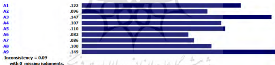
شکل ۷. تعیین اولویت هتل‌ها بر اساس معیار خلاقیت و نوآوری مدیریت

بر اساس شکل ۷، هتل ترنج با وزن ۰,۱۴۹ در اولویت اول قرار گرفته است. نرخ ناسازگاری مقایسه‌های انجام شده ۰/۰۹ بدست آمده است که کوچکتر از ۰/۱ می‌باشد. بنابراین، قابل اعتماد است.