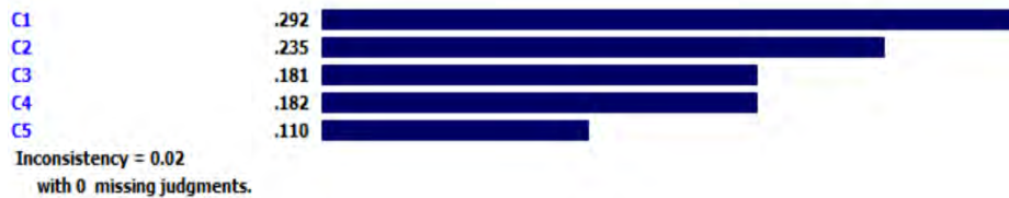
شکل ۲. نمایش گرافیکی اولویت معیارهای اصلی