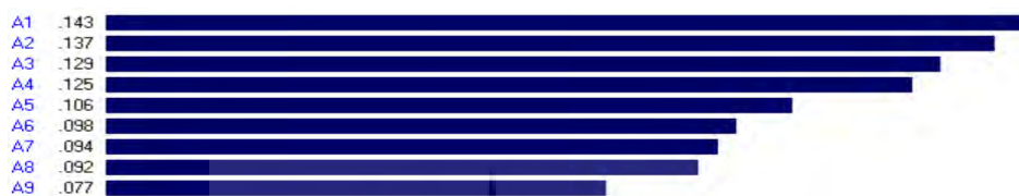
شکل ۸. تعیین اولویت نهائی هتل ها در اکسپرت چویس

شود. با در دست داشتن وزن هریک از معیارهای اصلی ( W_1 ) و زیرمعیارها ( W_2 ) وزن هریک از گزینه ها محاسبه می شود. در اینجا با وارد کردن میانگین هندسی مربوط به هر شاخص، عملیات فوق در نرم افزار Expert choice انجام شده و نتایج محاسبات انجام شده و اوزان مربوط به هر گزینه در شکل ۸ آمده است.