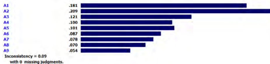
شکل ۳. تعیین اولویت هتل‌ها بر اساس سبک طراحی هتل