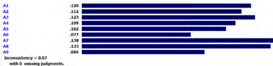
شکل ۶. تعیین اولویت هتل‌ها بر اساس معیار مدیریت