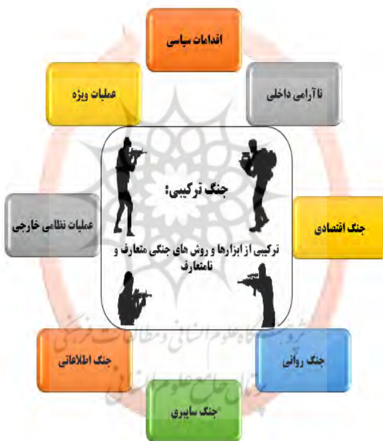
شکل ۲: روش جنگ هیبریدی از نظر کنفرانس امنیتی مونیخ

(۲۰۱۰) توجه به عملیات روسیه در اوکراین در شکل ۵ تعریف شده است: