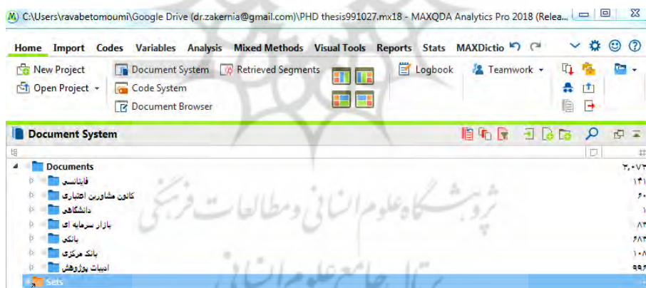
شکل (۱): تصویر خروجی نرم‌افزار MAXQDA از دسته‌بندی کلی کدهای تولید شده

با توجه به روش تحقیق که تحلیل مضمون هست کدهای به دست آمده از تحلیل مصاحبه‌ها ۱۰۷۶ کد بود و کدهای حاصل از تحلیل ادبیات پژوهش ۹۹۶ کد و در مجموع ۲۰۷۲ کد باز جهت تحلیل استخراج گردید.