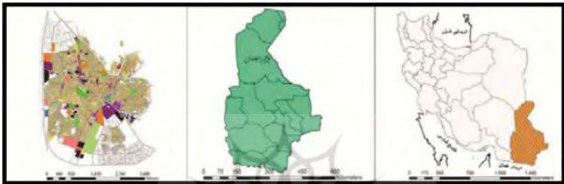
نقشه (۱): محدوده مورد مطالعه تحقیق

شهر زاهدان به عنوان مرکز مهم جمعیتی شرق کشور در ارتفاع ۱۳۸۵ متر از سطح دریا و در ۶۰ درجه و ۵۳ دقیقه طول شرقی و در ۲۸ درجه و ۵۸ دقیقه عرض شمالی قرار گرفته است. زاهدان از سمت شمال به شهرستان هامون و، از سمت جنوب به شهرستان خاش، از سمت شرق به کشورهای افغانستان و پاکستان و از سمت غرب به شهرستان فهرج منتهی می شود. توسعه شهر در دهه های ۱۳۳۰ تا ۱۳۵۰ کمتر از الگوی شطرنجی قبلی خود تبعیت کرده است. علت این تحول کالبدی نیز مهاجرت گروه های کم درآمد به این شهر و سکونت در نواحی پیرامونی آن بوده است.