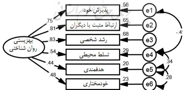
شکل ۱. مدل اندازه‌گیری پژوهش و پارامترهای آن با استفاده از داده‌های استاندارد

نکته: با توجه به این که بارهای عاملی استاندارد نشده مربوط به نشانگرپذیرش خود با عدد ۱ تثبیت شده لذا خطای استاندارد و نمرات t برای آنها محاسبه نشده است. جدول ۲ نشان می‌دهد که بالاترین بار عاملی متعلق به نشانگر رشد شخصی ( \beta = 0/826 ) و پایین‌ترین بار عاملی متعلق به نشانگر هدفمندی ( \beta = 0/443 ) است. طبق دیدگاه تاب‌آچینک و فیدل (۲۰۰۷) بارهای عاملی ۰/۷۱ و بالاتر از آن عالی، بارهای بین ۰/۶۳ تا ۰/۷۰ خیلی خوب، بارهای بین ۰/۵۵ تا ۰/۶۲ خوب، بارهای بین ۰/۴۵ تا ۰/۵۵ نسبتاً خوب ۱ ، بارهای بین ۰/۳۲ تا ۰/۴۴ پایین ۲ و بارهای پایین‌تر از ۰/۳۲ ضعیف محسوب می‌شود. بدین ترتیب با توجه به این که بارهای عاملی همه نشانگرها بالاتر از ۰/۳۲ بوده و بنابراین همه آنها از توان لازم برای اندازه‌گیری متغیرهای مکنون پژوهش حاضر برخوردار بودند. شکل ۱ مدل اندازه‌گیری پژوهش و پارامترهای آن با استفاده از داده‌های استاندارد را نشان می‌دهد.