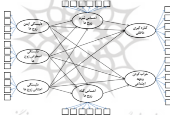
شکل ۱. الگوی پیشنهادی پژوهش