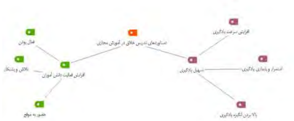
شکل ۳- خروجی مکس کیودا برای دستاوردهای تدریس خلاق در بستر آموزش مجازی