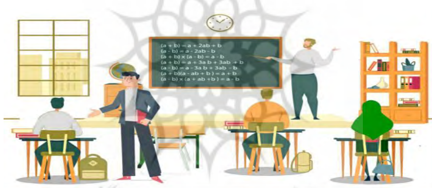
شکل ۳. جاگیری دانشجوی جدید (مرحله نهایی انحلال)

برای نشان دادن شباهت یا تفاوت میان ضمایم قیاس و هدف، فراگیران جدول را با عبارت‌های (مقایسه می‌شود با/مقایسه نمی‌شود با) کامل کنند.