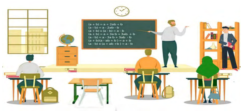
شکل ۲. ورود دانشجوی جدید (مرحله اول انحلال)

نخواهد داشت (در دانشگاهی که رقابت سنتی حاکم است). اگر خوشامدگویی آرایه شده توسط دانشجویان کلاس میزبان و خوشامدگویی احساس شده توسط بازدیدکنندگان، در مقایسه با دو فرایند دیگر (۱ و ۲) زیاد و قوی‌تر باشد، استقرار در کلاس صورت می‌گیرد