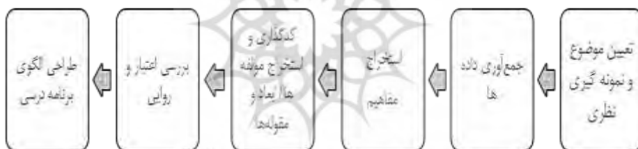
نمودار ۱. نمودار مراحل پژوهش

اطلاعات با استفاده از کدگذاری باز، محوری و گزینشی با استفاده از «الگوی کدگذاری ۲ » استروس و کوربین ۳ (۱۳۹۸) تحلیل شدند. در مرحله ابتدایی با بررسی مصاحبه‌های صورت گرفته در حوزه سواد مالی، نکات کلیدی، بیانات مهم و کدهای اولیه حاصل از مصاحبه نیمه ساختاریافته مورد استخراج قرار گرفت. سپس کدهای اولیه در چارچوب مفاهیم اولیه و در قالب و ساختار مشخص دسته بندی شدند. مفاهیم به دست آمده در مرحله کدگذاری باز اولیه به منظور تشکیل مقوله‌های عمده در کدگذاری محوری (یا متمرکز)، مورد تحلیل مجدد قرار گرفت. سپس این مقوله‌ها در بخش‌های مختلف شامل اهداف، مفاهیم و غیره تقسیم‌بندی و الگوی تبیینی طراحی برنامه درسی سواد مالی ارائه شد (نمودار ۱).