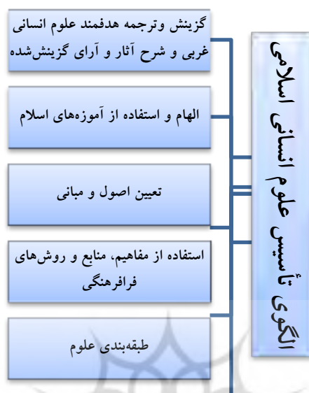
شکل ۲. الگوی تأسیس علوم انسانی اسلامی