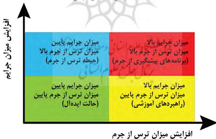
شکل ۲: ماتریس اطمینان‌آفرینی

ما در ادامه به معرفی ماتریس اطمینان‌آفرینی می‌پردازیم و سپس پاسخ‌هایی برای مقابله با ترس از جرم ارائه می‌نماییم.