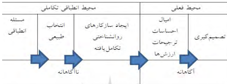
جدول ۱- فرایند تصمیم‌گیری در روش انتخاب عقلانی ۳۱

باشند. در نتیجه به‌مرور زمان تمام انسان‌ها از آن سازکار بهره‌مند خواهند شد. ۳۰ در گام پنجم توضیح داده می‌شود که یک سازکار روان‌شناختی، برای افزایش احتمال بقا و موفقیت تولیدمثلی انسان‌ها چه هیجان‌ها، عواطف، ادراکات و قضاوت‌هایی را ایجاد می‌کند. در گام ششم رفتارهایی که در نتیجه هیجان‌ها، عواطف، ادراکات و قضاوت‌ها ممکن است ایجاد شوند شرح داده خواهد شد. (جدول شماره ۱).