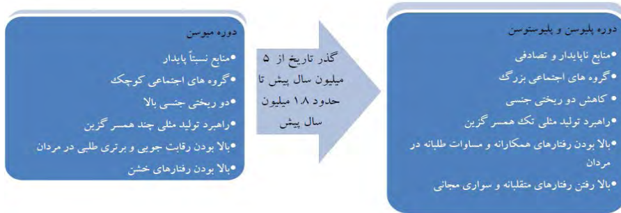
شکل ۲- حرکت راهبرد رفتاری انسان از الگوهای حاصل جمع صفر به سمت الگوهای حاصل جمع مثبت

انسان در گذشته دور تکاملی خود در محیط پر تعارض می‌زیسته است؛ به این معنا که رقابت میان گروه‌های کوچک بر سر منابع و قلمرو بسیار زیاد بوده و توانایی‌های شناختی برای غلبه بر این مسائل از اهمیت بالایی برخوردار بوده است.