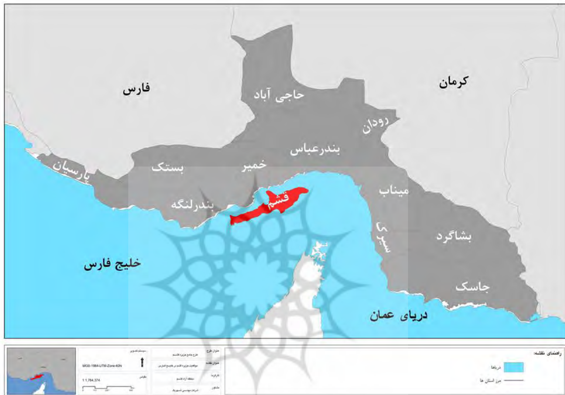
نقشه ۱. موقعیت جزیره قشم در استان هرمزگان و خلیج فارس

جزیره قشم در محدوده ۲۰' و ۵۵ تا ۴۰ و ۵۶ طول شرقی و ۳۰ و ۲۶ تا ۱۰ تا ۲۷ عرض شمالی در جنوب ایران و در خلیج فارس قرار دارد. مساحت این جزیره با توجه به جزر و مد بین ۱۵۰۰ تا بیش از ۱۶۰۰ کیلومتر مربع تغییر می‌کند. جزیره قشم طولی بالغ بر ۱۱۰ کیلومتر و پهنای ۱۰ تا ۳۰ کیلومتر دارد. مساحت این جزیره با احتساب گستره جنگل حرا از ۱۵۳۶ تا ۱۷۹۶ کیلومتر مربع متغیر است (امری کاظمی، ۱۳۸۳).