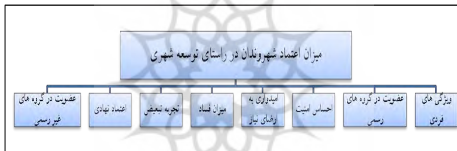
نمودار ۱. مدل مفهومی پژوهش

- عضویت در گروه‌های رسمی و غیررسمی: در این تحقیق منظور از گروه‌های رسمی، گروه‌ها و انجمن‌های هنری و ادبی، اولیا و مربیان، صنفی و حرفه‌ای، احزاب و گروه‌های سیاسی، انجمن‌های خیریه و مذهبی، علمی، ورزشی، بسیج و تعاونی‌های غیر دولتی است. برای سنجش آن از افراد پرسیده شده که در کدام یک از گروه‌های فوق عضویت دارند و برای سنجش عضویت در گروه‌های غیررسمی، مدت زمانی را پاسخگو به تعامل و گفتگو با اعضای خانواده، همسایگان و دوستان در یک هفته می‌پردازد؛ سنجیده شد. از اینرو مدل مفهومی پژوهش به صورت دیاگرام بصورت زیر در نمودار شماره (۱) نشان داده شده است.