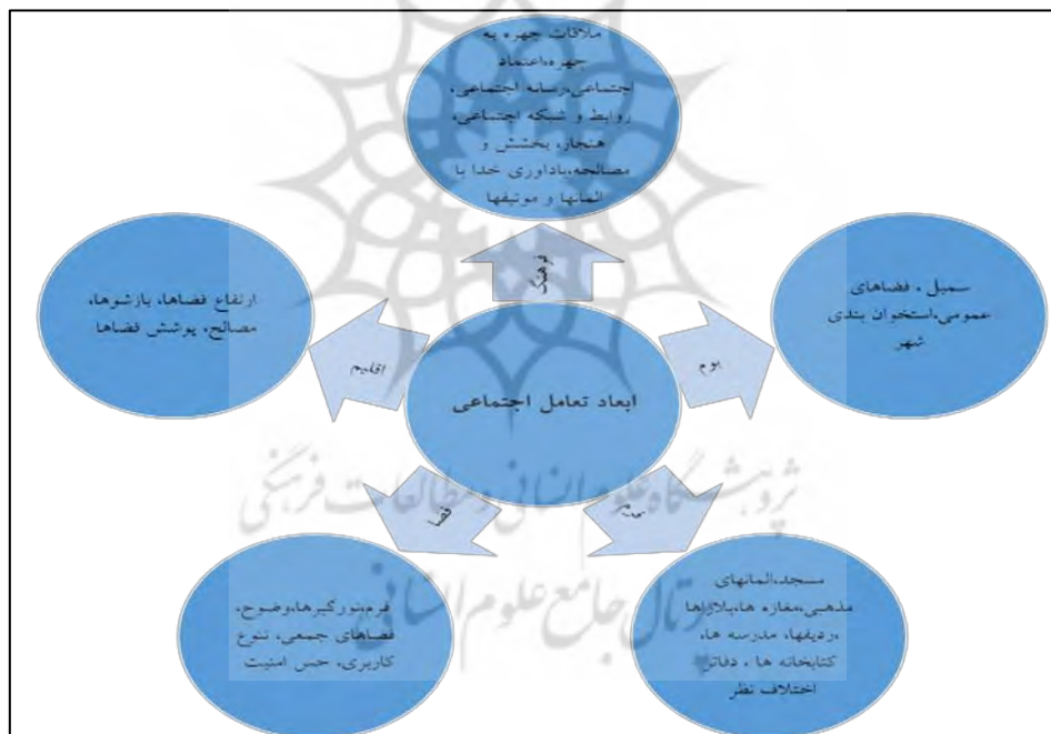
نمودار ۳: Error! No text of specified style in document. الگوی ارتباط بین متغیرهای مستقل و وابسته

یکی از خصوصیات دیگر بازار ایرانی شکل گرفتن در پی یک هدف نهایی با به هم پیوستگی اجزاء می باشد به طوری که حجره ها، راسته ها، دالان ها، چهارسوق ها، تیمچه ها و سراها در کنار هم ایده نهایی بازار را شکل داده، هم تجارت و هم با خصوصیات انسانی، چون بخشی از جامعه به زندگی خود ادامه می دهند. با توجه به خصوصیات چندجانبه مکان، بازار به عنوان مکانی که شکل دهنده فعالیت های انسانی است نشان داده که با بکار گیری فعالیت اجتماعی در کالبد معماری، حس تعلق، خاطره جمعی و حس مکان در ادراک انسان تقویت می شود. در بعد اجتماعی، تعاملات اجتماعی و نقش بازار در شکل گیری آن از اهمیت چشمگیری برخوردار است. ساختار کالبدی بازار در این بین نقش پررنگ تری دارد. سقف مدور گنبدی که در اجزای مختلف بازار دیده می شود در معماری اسلامی دارای مفاهیم عرفانی و حکمت است که به طور خلاصه نمادی از تجمع و گردهمایی است که از خاصیت معماری گنبد مسجد الهام گرفته شده است و فضایی روحانی، صادق، آرام بخش با حس تعلق را به مخاطب القا می کند. دهانه باریک و کم عرض راسته ها، در ایجاد تعامل اجتماعی بین کسبه دو طرف راسته نقش اساسی دارد، در حالی که دو نفر در حجره خود نشسته اند، می توانند با هم ارتباط نگاهی و کلامی داشته باشند و امنیتی که ناشی از ساختار کالبدی بازار سنتی است ایجاب می کند تا مغازه دار ساعت ها حجره اش را ترک کند در حالی که همسایه او به حجره او توجه دارد.