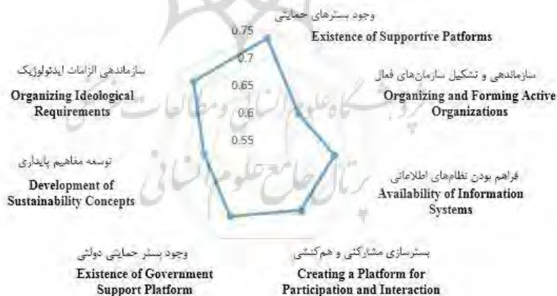
نمودار ۱. اولویت‌بندی پیشایندهای دانشگاه پایدار و دوستدار محیطزیست

همان‌طور که در مطالب قبلی نیز اشاره شد، با توجه به مقایسه نتایج دیدگاه‌های ارائه‌شده در مرحله اول و دوم، در صورتی که اختلاف میانگین فازی‌زدایی‌شده در دو مرحله، کمتر از ۰/۱ باشد، فرایند نظرسنجی متوقف می‌شود. در پژوهش حاضر، همان‌گونه که ملاحظه می‌شود، اختلاف میانگین فازی‌زدایی‌شده نظرات خبرگان در دو مرحله از ۰/۱