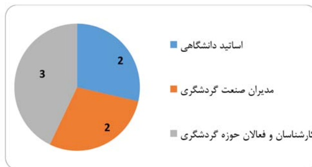
شکل ۳: ترکیب و تعداد خبرگان مصاحبه بر حسب تخصص و زمینه فعالیت

ملاک انتخاب خبرگان برای مصاحبه (در فاز اول و دوم)، نخست، آشنایی نظری آن‌ها با مفاهیم گردشگری فرهنگی و دوم داشتن سابقه یا زمینه فعالیت عملی در یکی از حوزه‌های مرتبط با گردشگری فرهنگی (به‌ویژه موسیقی) بوده است. بر این اساس، مصاحبه‌شوندگان از میان استادان دانشگاه، مدیران صنعت و کارشناسان حوزه گردشگری فرهنگی شناسایی و انتخاب شدند. شکل ۳ خبرگان مرحله مصاحبه را بر حسب تخصص کاری به تصویر کشیده است. همان‌گونه که ملاحظه می‌شود، در