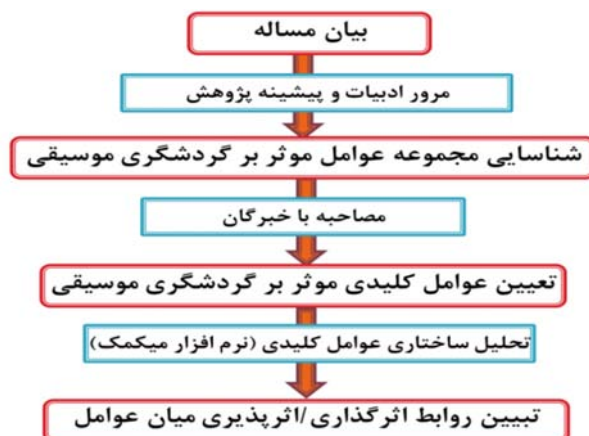
شکل ۱: مراحل فاز اول روش‌شناسی تحقیق

پژوهش حاضر، از لحاظ هدف، از آنجاکه با شناسایی کاستی‌ها و عوامل کلیدی مؤثر در توسعه گردشگری موسیقی در پی رونق و توسعه این نوع گردشگری در کشور (و استان بوشهر) است، تحقیقی کاربردی از شاخه پژوهش‌های پیمایشی - توصیفی به‌شمار می‌رود. گردآوری و تجزیه و تحلیل یافته‌ها در دو فاز برنامه‌ریزی انجام شده است. در فاز نخست، عوامل کلیدی مؤثر در گردشگری موسیقی شناسایی می‌شوند. بر این اساس، نخست، از طریق مرور ادبیات و پژوهش‌های مرتبط پیشین، مجموعه عوامل اثرگذار در گردشگری موسیقی احصا شد و سپس، از طریق مراجعه